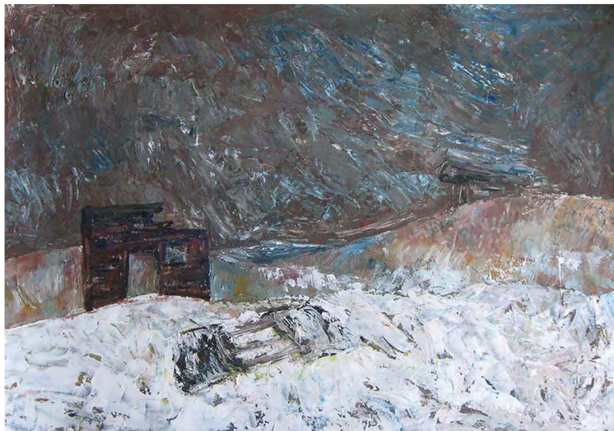
Дария Ластушкина. Пейзаж № 3. 2016. Бумага, акрил. 61x86