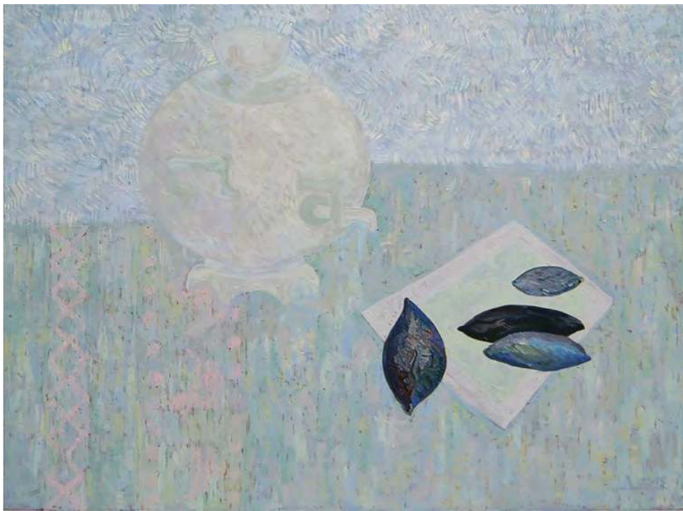
Дария Ластушкина. Натюрморт с пирогами № 1. 2015. Холст, масло. 60x80

уже новой действительностью. Тем не менее изобретение Луи Дагера, угрожавшее потеснить живопись (но тревога оказалась ложной), кажется, могло подтолкнуть изящное искусство сделать шаг в сторону от относительно реалистического подхода в сторону «измов», которые, несмотря на то, что каждый раз разделяли и складывали пространство новым способом, оказались не менее верны, чем изображения, полученные с помощью камеры-обскуры, — просто верны иначе.