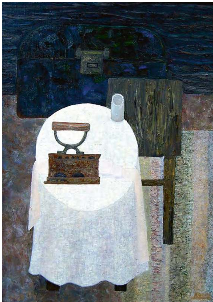
Дария Ластушкина. Натюрморт с утюгом № 1. 2014. Холст, масло. 85x60

уже новой действительностью. Тем не менее изобретение Луи Дагера, угрожавшее потеснить живопись (но тревога оказалась ложной), кажется, могло подтолкнуть изящное искусство сделать шаг в сторону от относительно реалистического подхода в сторону «измов», которые, несмотря на то, что каждый раз разделяли и складывали пространство новым способом, оказались не менее верны, чем изображения, полученные с помощью камеры-обскуры, — просто верны иначе.