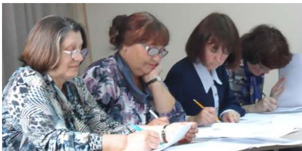
Члены экспертного совета за работой