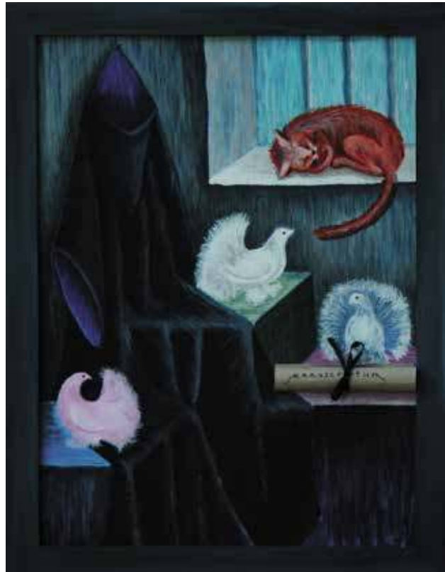
Волшебник в отпуске

В такой интерпретации становится понятнее, почему многие творчески одаренные люди одновременно показывают выдающиеся способности к разным видам искусства. Думаю, таких людей должно быть гораздо больше, однако ограниченность человеческой жизни не позволяет большинству людей в достаточной степени развить себя. Каждое занятие требует достаточного мастерства, на овладение которым уходит основное время. Это так называемая механическая, техническая сторона процесса: танцовщица должна безукоризненно владеть своим телом, изо дня в день на протяжении многих лет отрабатывать движения у станка, литератор должен подчинять себе слова, музыкант — знать нотную грамоту, обладать достаточной моторикой пальцев и т. д. Этому можно научиться и