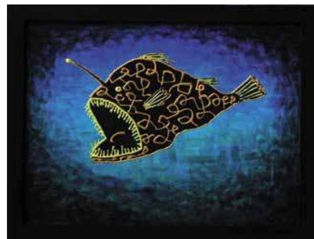
Рыба-удильщик (картина внутренней борьбы)