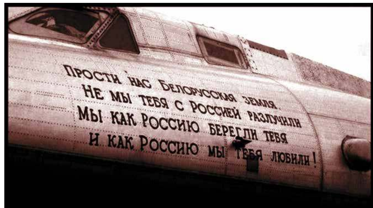
Белоруссия, Бобруйский гарнизон. Покидали Беларусь с тяжелым сердцем