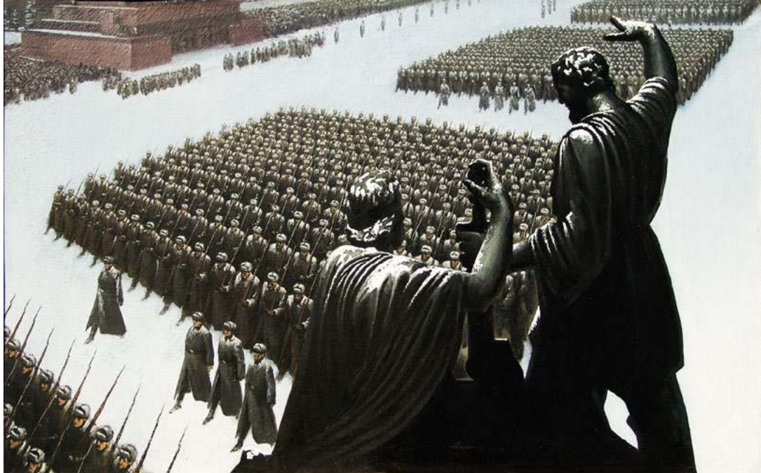
Парад 41 г.