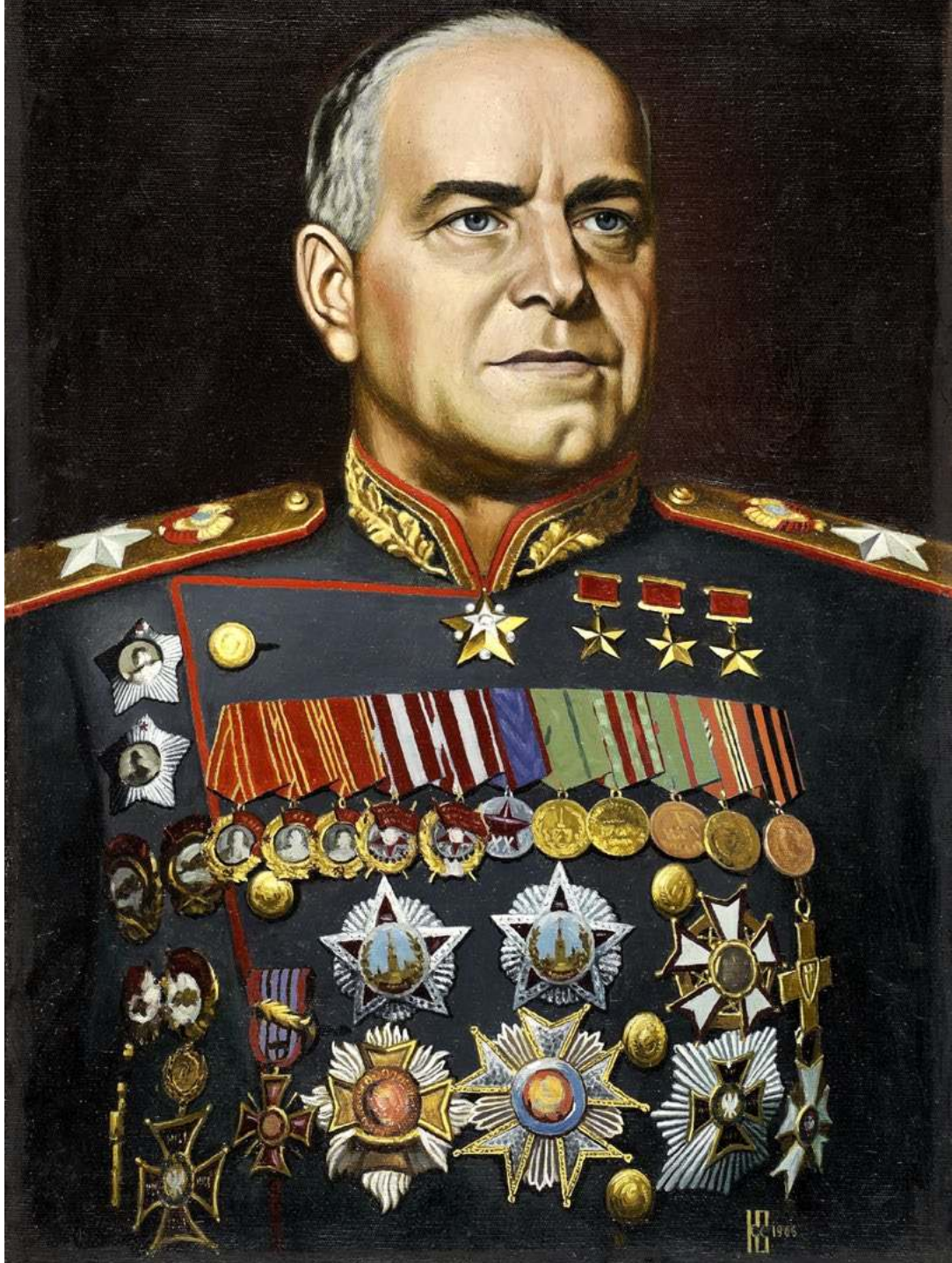
Портрет маршала Жукова