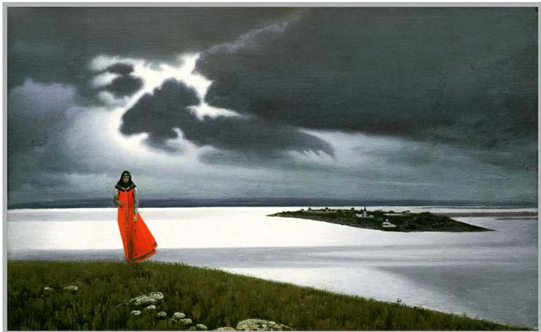
Над Волгой (Свияжск)