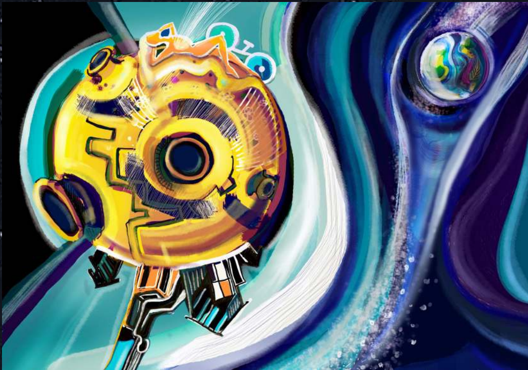
И. Железняк. «Мир»