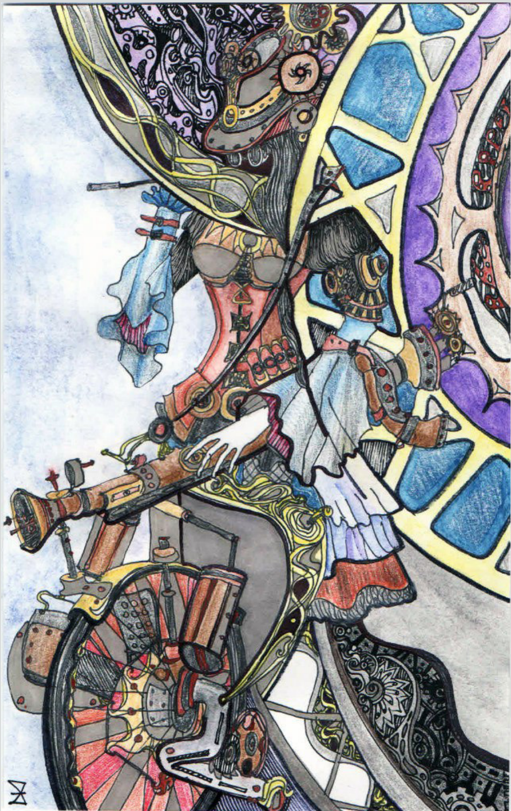
И. Железняк. «День принцессы»