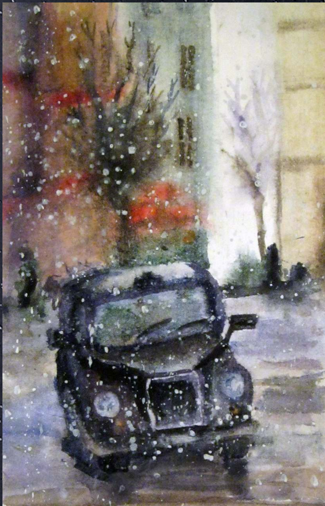
И. Железняк. «Первый снег»