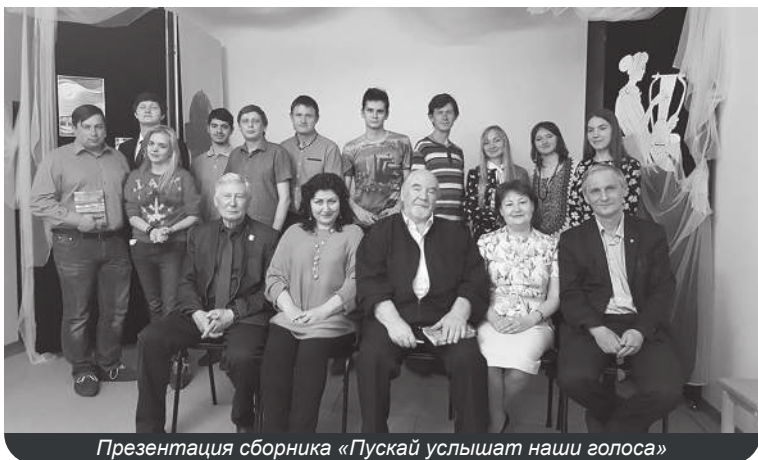
Презентация сборника «Пускай услышат наши голоса»