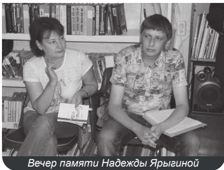
Вечер памяти Надежды Ярыгиной