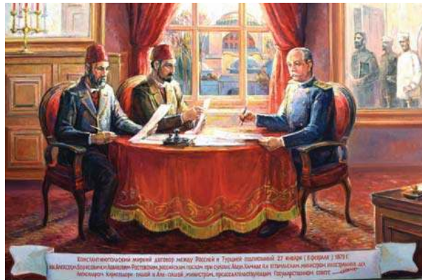
А. Каратеодори, Али-паша и А.Б. Лобанов-Ростовский подписывают Константинопольский мирный договор 27 января 1879 г. Худ. Николай Русев, Варна, 2018 г.

– после длительных обсуждений 27 января (8 февраля) 1879 г. между А.Б. Лобановым-Ростовским и турецким министром иностранных дел А. Каратеодори-пашой был подписан долгожданный окончательный русско-турецкий договор, закрепивший те условия Сан-Стефанского договора, которые не были отменены или изменены Берлинским трактатом.