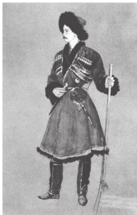
М.Б. Лобанов-Ростовский в первые годы службы на Кавказе (ок. 1843). Худ. Г.Г. Гагарин. Портрет хранится в Государственном Русском музее в Санкт-Петербурге.

Отмечены этапы его образования и карьеры, среди которых: «выпускник Царскосельского лицея с золотой медалью»;