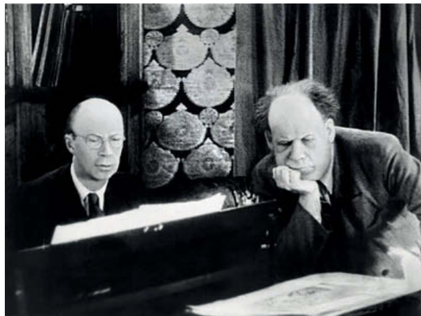
Композитор С. Прокофьев с кинорежиссёром С. Эйзенштейном

побывал в родном селе после 1910 года (в этом году умер его отец), я ни в одном из сохранившихся источников информации, находящихся в свободном доступе, так и не нашёл.