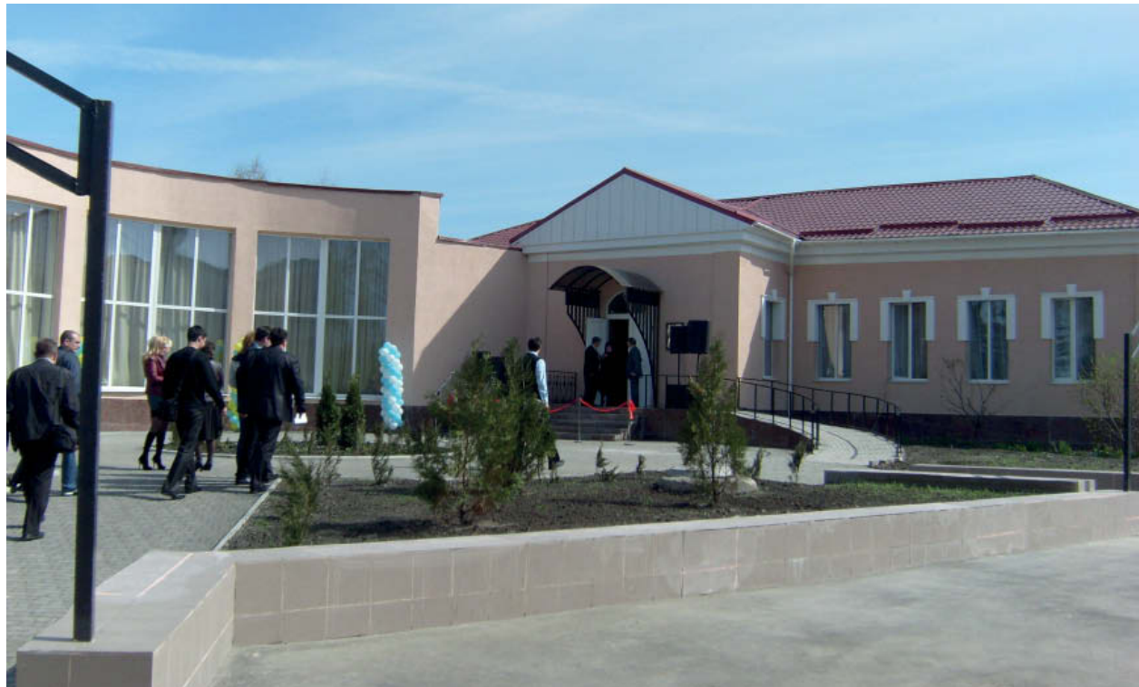
Музей Сергея Прокофьева с концертным залом в с. Красном