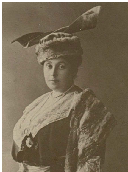
С. Буксгевден

Когда подушка ещё пребывала со мной, я и мои знакомые, знавшие о ней, часто прибегали к её помощи для избавления от головных болей, приложив её к болящей голове, что свидетельствует о сохранении ею благодатной силы любви, вложенной в неё святой Царской Семьёй».