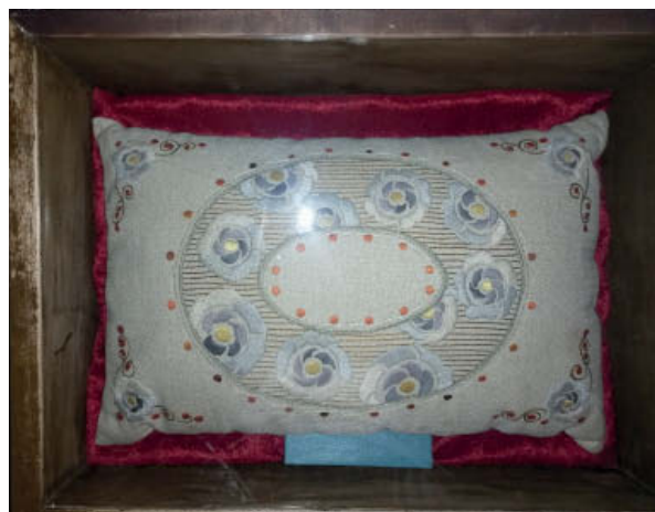
Фото царской подушки из Феодоровского Государева собора

Благодарю всех, кто помогал в поисках материалов, связанных с семьёй Хованских и драгоценной православной реликвии, проделавшей путь от Тольска через Калининград в Пушкин.