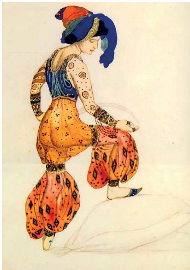
Леон Бакст. Синяя султанша