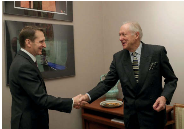
С. Е. Нарышкин приветствует Н. Лобанова в помещении Русского исторического общества. Москва. 2020