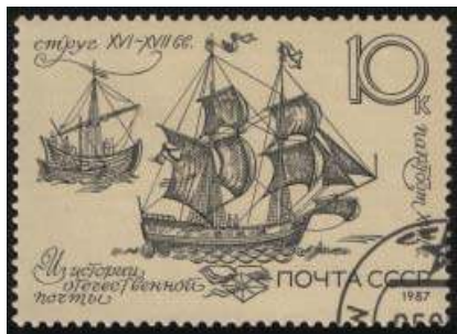
Пакетбот XVIII века на советской марке 1987 года

возможность станет реальностью: Россия и Пруссия столкнутся в Семилетней войне. Пока же Фридрих II, занятый присоединением Силезии и стремившийся союзным договором с Россией удержать другие державы от выступления против Пруссии в австро-прусской войне, решил воспользоваться сменой власти в России и предложил ей заключить новый договор. Переговоры шли долго и трудно, так как Россия уже не доверяла Пруссии. Однако в конце 1742 года императрица Елизавета Петровна направила Фридриху II орден святого Андрея Первозванного, а Фридрих в ответ направил русской императрице орден Чёрного орла. Это сказалось благотворно на переговорном процессе, и 16 марта 1743 года в Санкт-Петербурге был заключён новый союзный договор между Россией и Пруссией. Этот договор не привёл к действительному сближению двух держав, но лишил Фридриха II возможности оказывать какую-либо помощь Швеции в продолжавшейся русско-шведской войне. Таким образом, трофейный пакетбот нашёл в Пиллау вполне надёжное убежище. Шведам пруссаки его теперь не выдали бы.