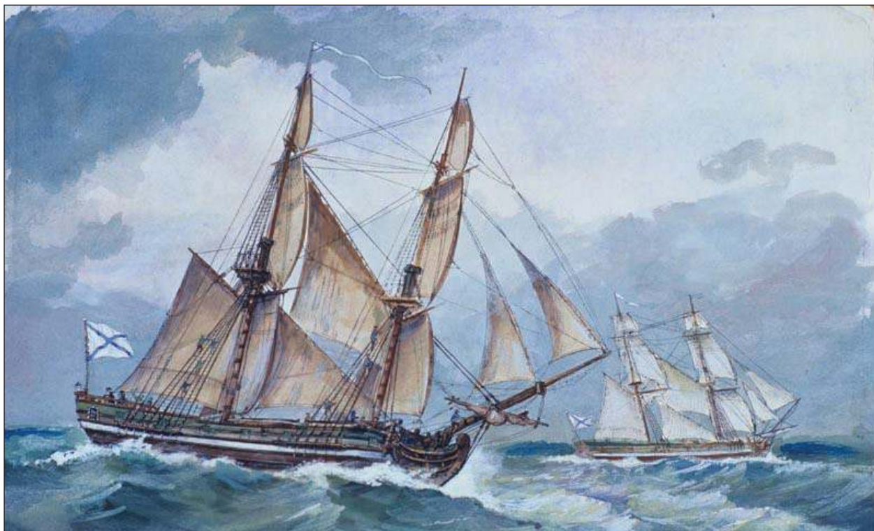
Изображения пакетботов «Святой Пётр» и «Святой Павел», были построены по чертежам, сметам и ведомостям «Меркуриуса», на них совершалась экспедиция Беринга

22 марта «Меркуриус» захватил на рейде Гданьска очередное шведское судно. На сей раз это была яхта «Юнгфрау-Катарина» с грузом железа, оцененного в 600 талеров. Призом стали также 110 талеров медной монеты наличности. В шведской столице тем временем паника усиливалась. Согласно дошедшим до Стокгольма слухам, судоходство у Гданьска было полностью парализовано двумя русскими кораблями. Некоторые утверждали, что русские корабли были фрегатами. Командование шведского флота срочно направило в сторону Гданьска целую эскадру в составе двух фрегатов