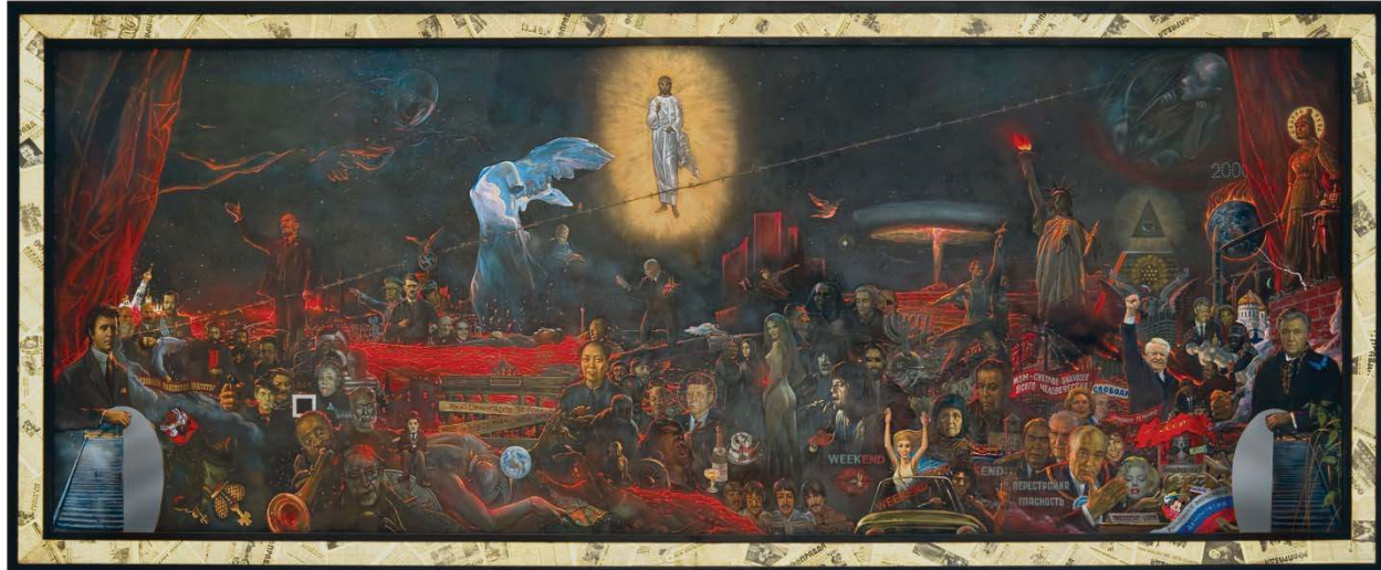
Мистерия XX века