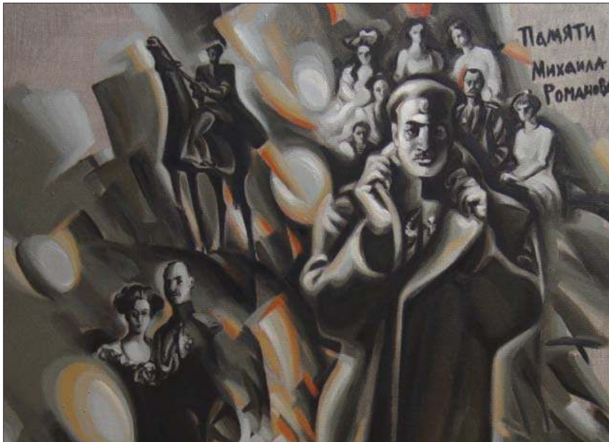
Полотно преподавателя академии художника Льва Ивановича Первалова