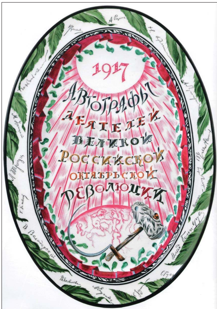
Блюдо «Деятели великой Октябрьской революции 1917 г.», Петроградский фарфоровый завод, по рисунку С. Чехонина, 1921 г. 17 подписей на ободке, по часовой стрелке снизу: А. Енукидзе, В. Яковлева, В. Володарский, Г. Зиновьев, Л. Троцкий, М. Урицкий, Н. Подвойский, К. Еремеев, А. Рязанов, Н. Крестинский, А. Луначарский, В. Ульянов, Г. Чичерин, А. Коллонтай, В. Бонч-Бруевич, С. Гусев, С. Зорин. Сталин и Бухарин отсутствуют.

Каковым было влияние иностранных держав на то, что происходило в России между февралём и октябрём?