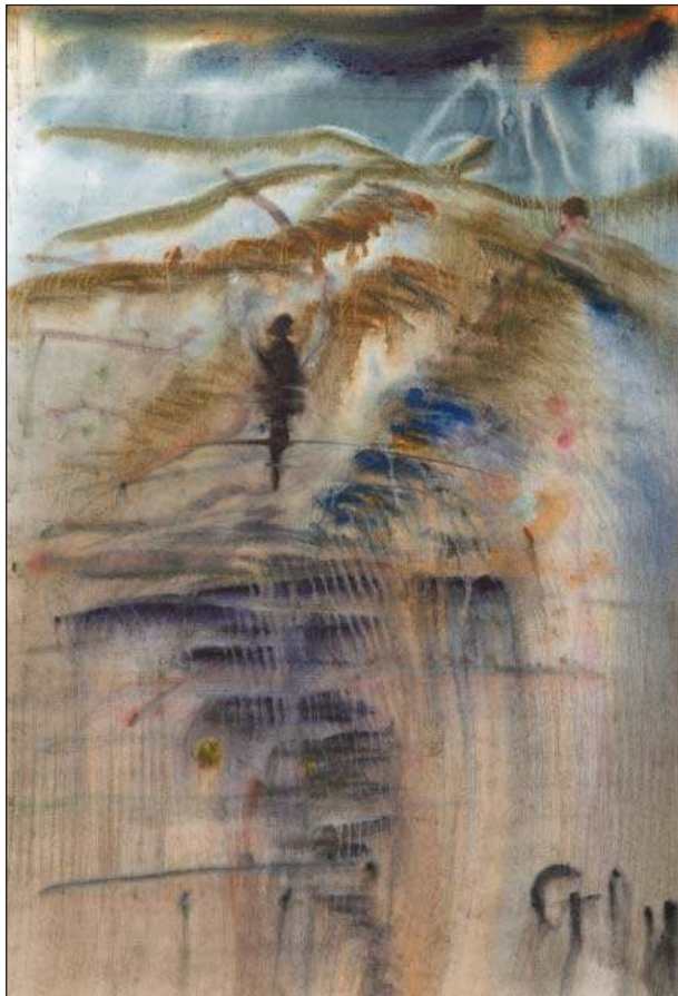
Одиночество во вселенной