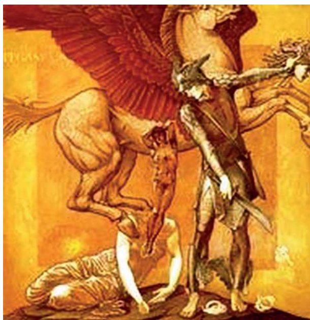
Рождение Пегаса и Хрисаора из крови Медузы. Автор сэр Эдвард Берн-Джонс, 1876–1885 гг., картинная галерея Саутэмптон-Сити

Задача «победного» мифа – очернить противника, оправдать убийство его, но почему-то не вышло. У «чудовища» Медузы Горгоны родились прекрасные дети. Хрисаора знают мало, зато крылатый конь Пегас прочно укоренился как общемировой символ вдохновения всех художников и поэтов. Видно, традиции скифской земли оказались сильнее олимпийской ревности и полной победы не получилось.