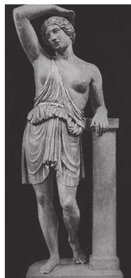
А грудь не изувечена (!) даже в скульптурных памятниках тех самых «древних греков»!