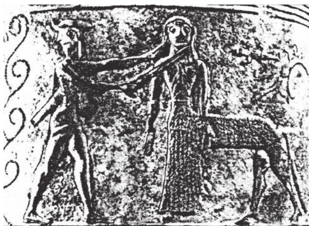
Рельефное изображение на амфоре, найденной в одной из областей Греции (Беотия): отвернувшийся от глаз Медузы Персей, готовый её обезглавить