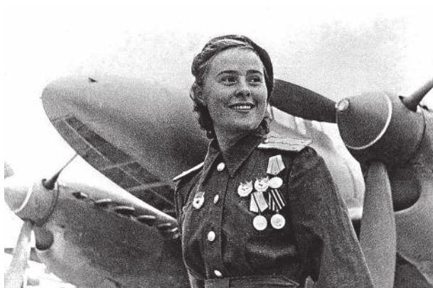
Советская амазонка на войне. Замещает коня крылатая военно-воздушная машина