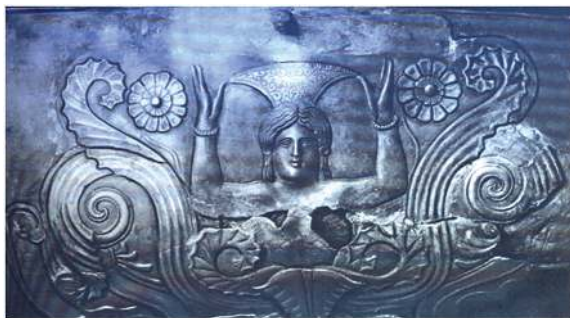
Скифская богиня (серебряный сосуд из кургана Чертомлык, Днепропетровская обл.), раскопки И. Е. Забелина, IV до н. э.

Но с воцарением Олимпийского Пантеона с Зевсом во главе всё изменилось. Горгона «познала горе». Необходимо было унижить врагов, оправдать войну с ними, чтобы захватить их страну и все её богатства (в современном мире это называется «гибридная война»). Судите сами, вот какие им дали имена: Энио («Воинственная»), Пемфредо («Оса»), Дино («Ужасная»). Сейчас, в XXI веке, ситуация в этих «волшебных краях» такая же. Стратегия мировой политики не меняется никогда, это старо как мир, и всё по-прежнему. Вот почему титанид «сделали» отвратительными чудовищами, к красавице Медузе, благодаря грекам, пристало прозвище Горгона (от греч. «Gorgo» – чудовище). История олимпийцев – это борьба тщеславных ревнивцев за власть. В этой борьбе они не считают ни с кем и ни с чем. Они – центр Вселенной, её Закон. Так всегда считали эти самые олимпийцы, но остальной мир думал иначе. Совсем иначе.