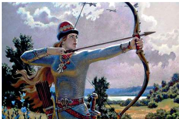
Дева русских былин