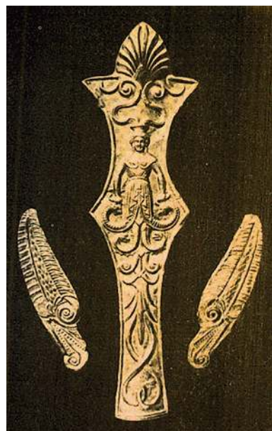
Конский налобник (из захоронения знатного скифа) с изображением змееды-прародительницы. Золото. IV ст. до н. э., курган «Велика Цимбалка» вблизи с. Великая Белозёрка Запорожской обл., раскопки И. Е. Забелина, Государственный Эрмитаж

Характер такого «конфликта» равнялся Мировой Войне в самом настоящем понимании этого слова и со всеми вытекающими из этого факта выводами. Эллина, пришедшие в будущую Грецию, ещё хранили образ прекрасной «лебединой девы».