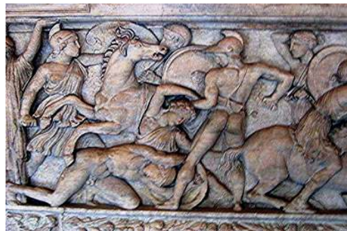
Амазономахия. Греческий барельеф. Лувр

голове вместо волос змеи, а взглядом своим превращают всё живое в камень. Настоящие античные валькирии, летающие по небу над миром во время своей страшной охоты.