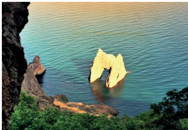
Вид из ущелий Берегового Хребта на «Золотые Ворота» Кара-Дага в последний момент захода солнца, при эффекте красного луча

мять об убитой сопернице. До конца это не удалось. Скифы продолжали почитать свою Змеядеву, а за попытку её очернить относились к грекам с величайшим и жесточайшим презрением.