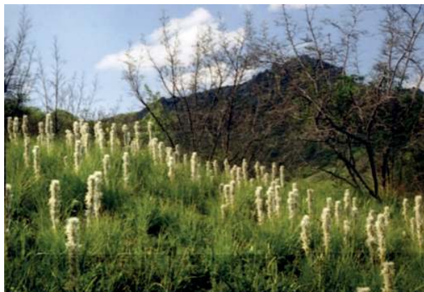
Луга печальных асфodelий (в Кара-Даге)