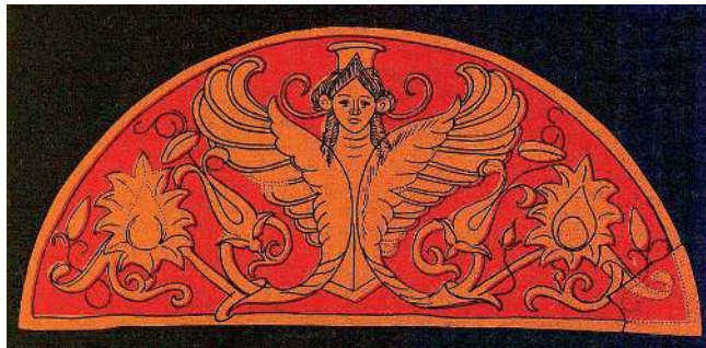
Изображение на зеркале, Северное Причерноморье, IV в. до н. э.