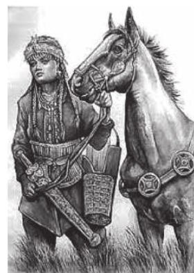
У скифо-сармат (реконструкция)

одного мифа. Геродот, будучи в Ольвии, в V в. до н. э., слышал похожее предание о киммерийцах, где герой-всадник встретил Змеядеву, которая родила ему сыновей. Так возникло новое племя – скифы. Не станем утверждать, что дева называлась Медузой, но она явно доводилась родственницей последней, хоть и дальней. Иное предположить невозможно.