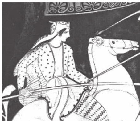
Амазонка. Рисунок на античной вазе