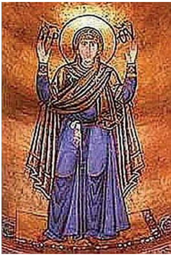
София Оранта, Киев, украшение собора, XI в.