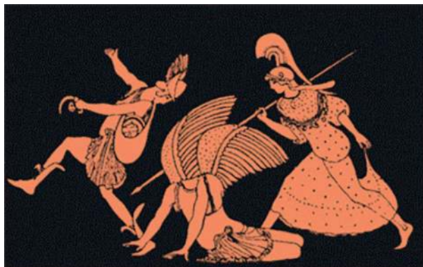
Убийство Медузы Персеем, рядом Афина. Фрагмент росписи гидриши, мастер Пан, ок. 460 г. до н. э.

Хрисаор, имеющий прозвище Лук Золотой и чей поднятый меч «достигает небес».