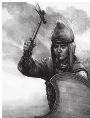
Девушка-воин у саков