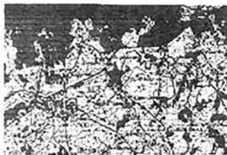
9. Карта расположения