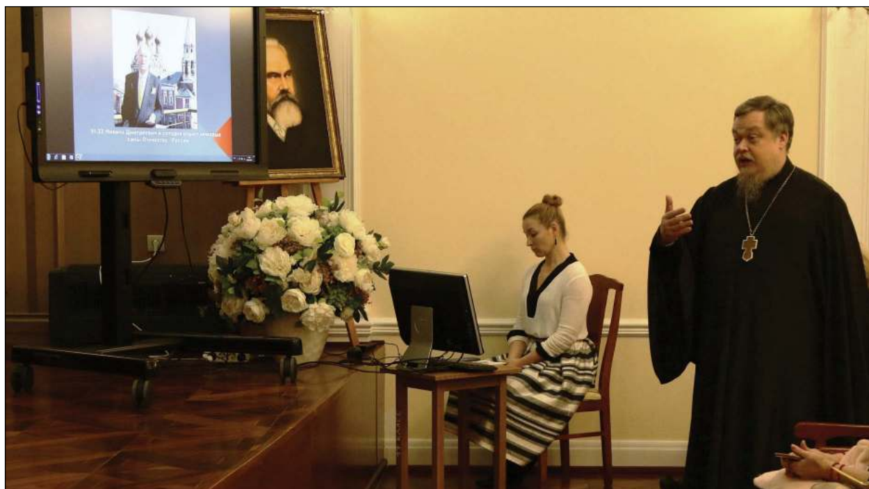
Протоиерей Всеволод Чаплин