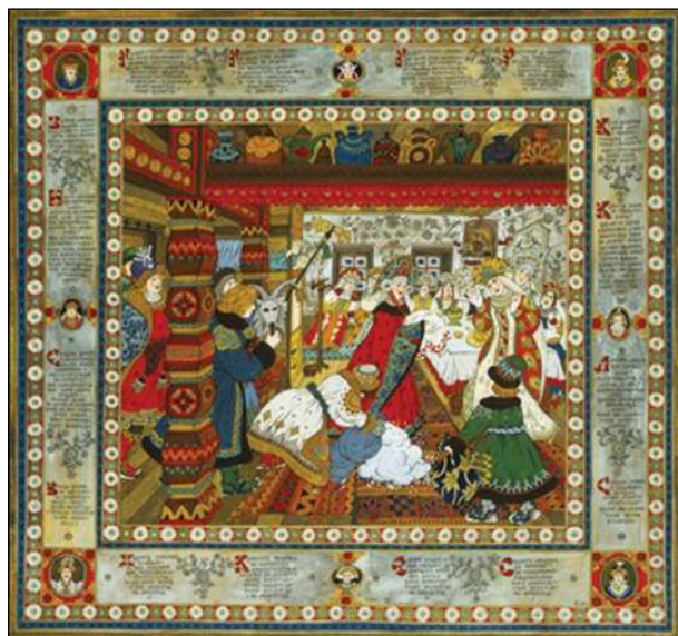
Игра в мельника