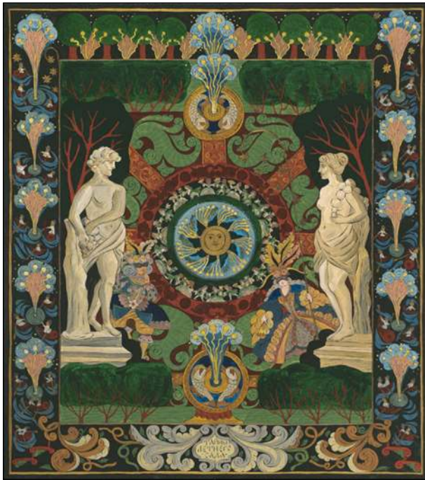
Тайны Летнего сада