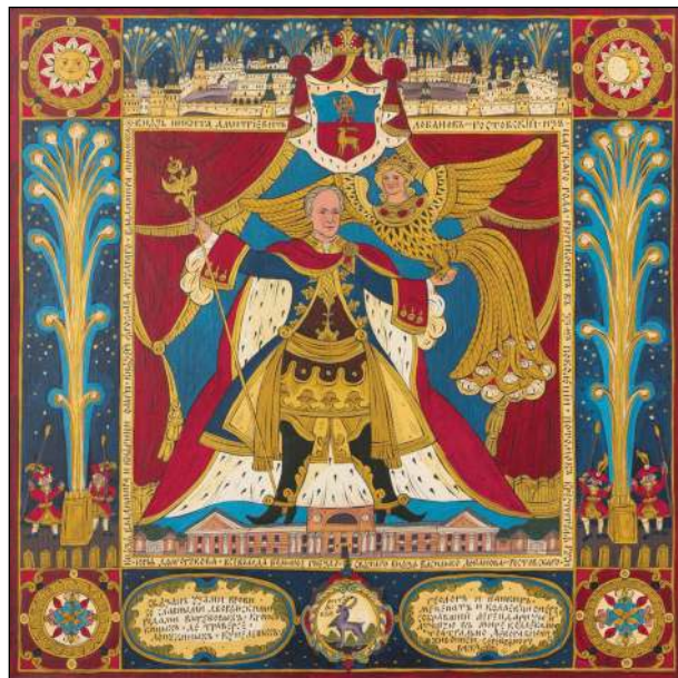
Чествование князя Никиты Дмитриевича Лобанова-Ростовского». Худ. О.Соколова. Холст. Акрил. 60х60см. 2019

Мне лубочные картины нравятся давно, я к ним пришла, ещё учась в Московской художественно-промышленной академии имени Строганова. В то время – это был конец 80-х годов – меня учили проектировать интерьеры, выставки. Мало, что из замыслов можно было воплотить и реально построить. А мне захотелось чего-то большего, чем анодированный алюминий. И я обратилась к жанру лубочных картинок, потому что они меня потрясли лаконичностью образов и выразительностью текстов. Я увидела их в музеях, мне попались на глаза некоторые листы из собрания Дмитрия Ровинского «Русские народные картинки». Я увлеклась, стала изучать, купила книги по истории лубка. Сначала я копировала листы – мне хотелось понять пластический язык и овладеть им. А потом я почувствовала, что могу плыть сама по себе, оттолкнувшись, как лодка от берега. Занимаюсь лубком 35 лет.