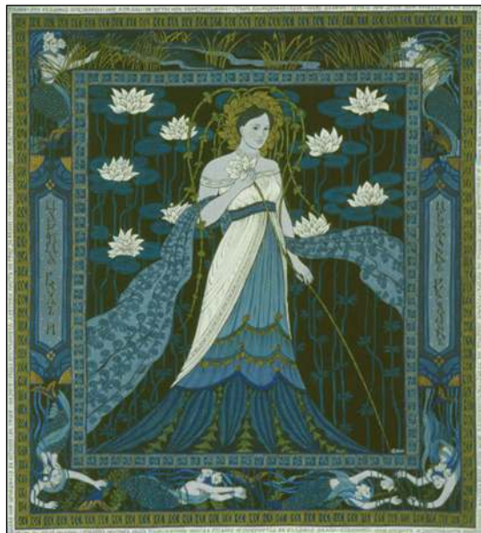
Царица вод и цветок русалок

Его обычаи, обряды, предания, суеверия и поэзия», собранные Михаилом Забылиным, «Народная Русь: Круглый год сказаний, поверий, обычаев и пословиц русского народа» Аполлона Коринфского. Было прочитано и пересмотрено очень много документальных фильмов, куплено и прослушано записей народных песен, былин, народных театральных сценок, я уж не говорю про сами лубочные картинки с их потрясающими текстами из собрания Дмитрия Ровинского.