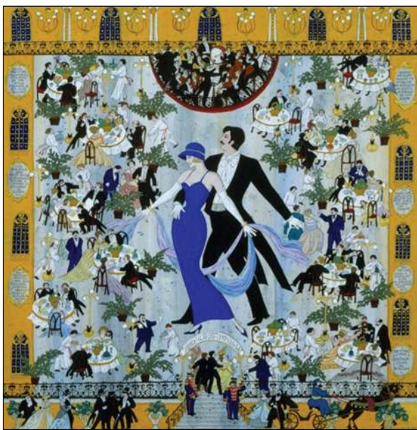
Ресторан начала XX века

Это бомбардиры, фейерверкеры. Они Лобанову-Ростовскому отвечают салютом. Фейерверки в честь Никиты Дмитриевича.