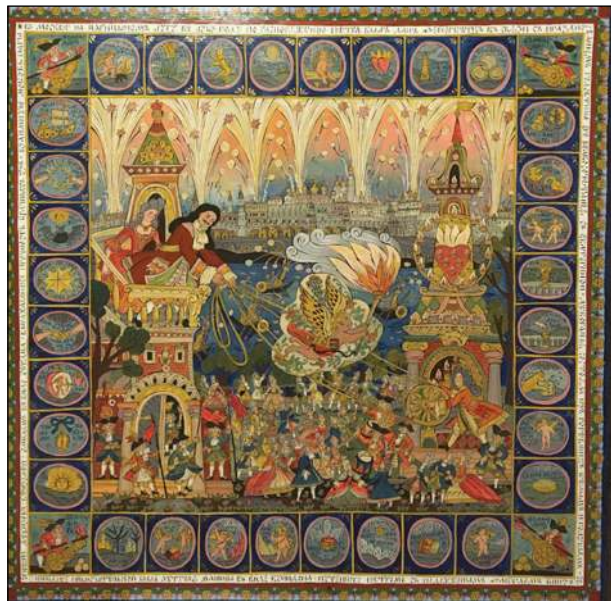
Фейерверк с Купидоном