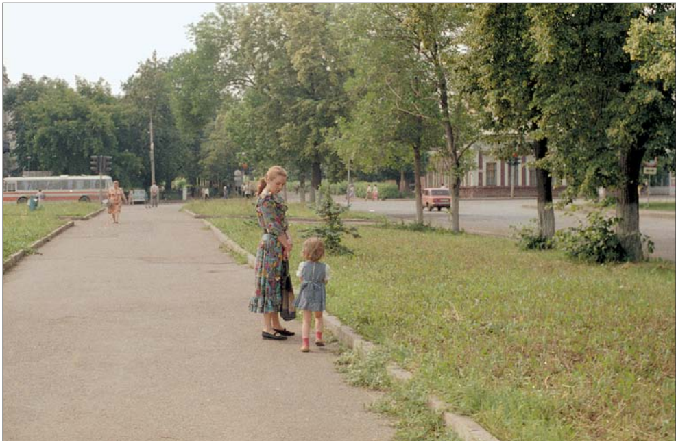
На улице Кирова. 1990