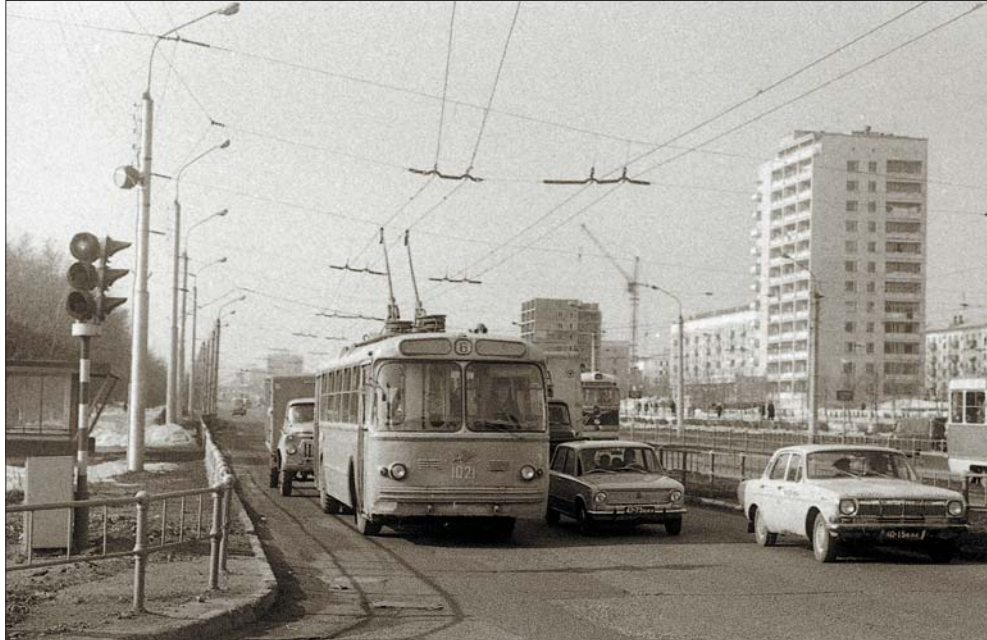
Перекрёсток (остановка «Спортивная»). 1974