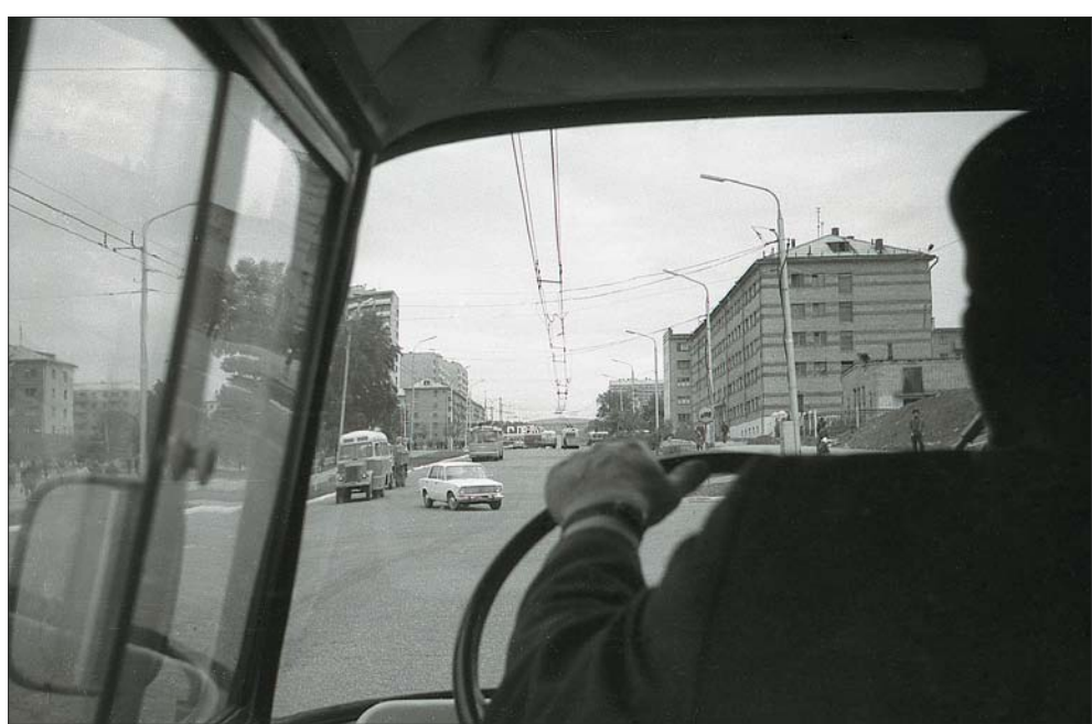
Когда не было развязки. Ул. 50 лет СССР, 1973