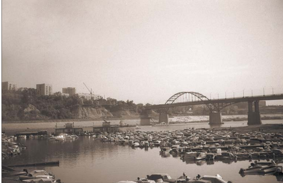
Лодочная станция. 1976