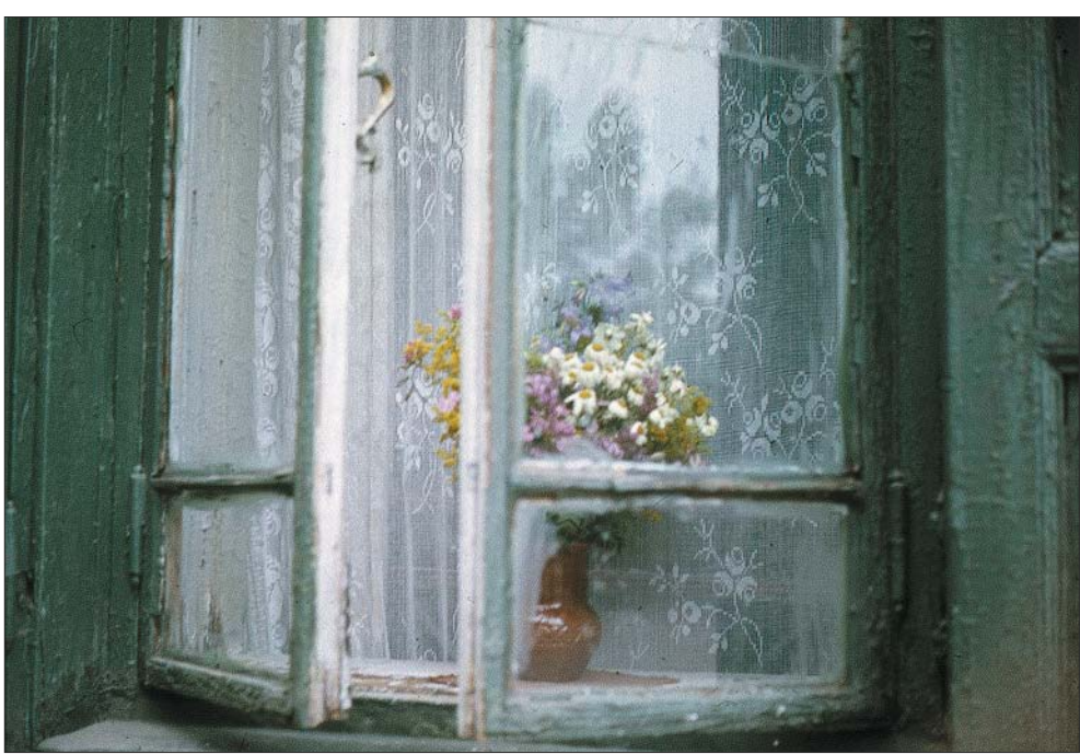
Букетик (на углу Пушкина и Гоголя). 1987