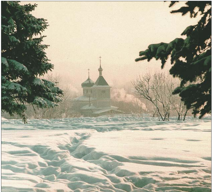
Розовый рассвет (Сергиевская церковь). 1994