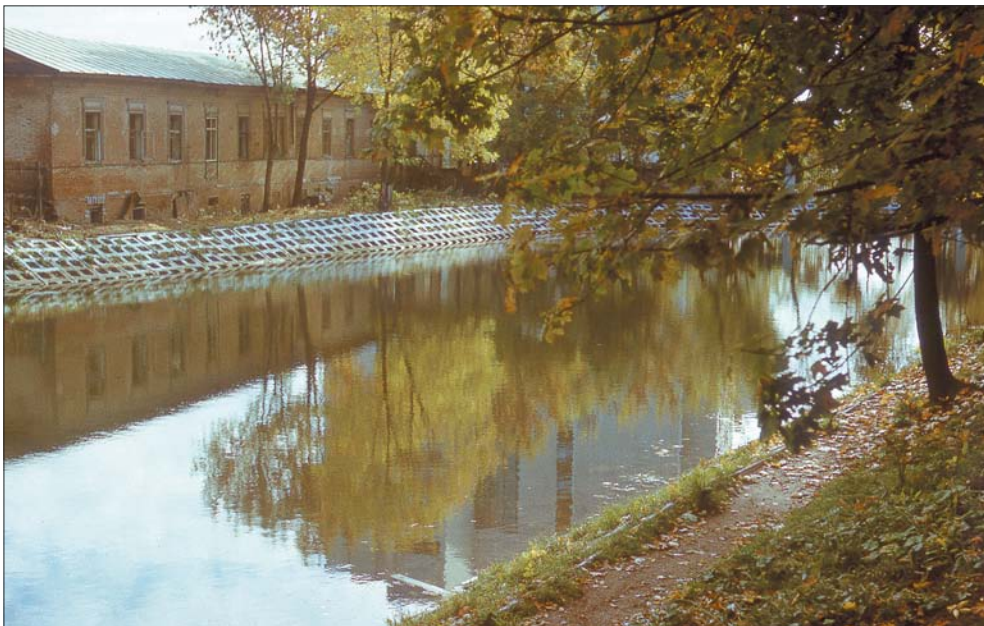
Осень старого сада. 1991