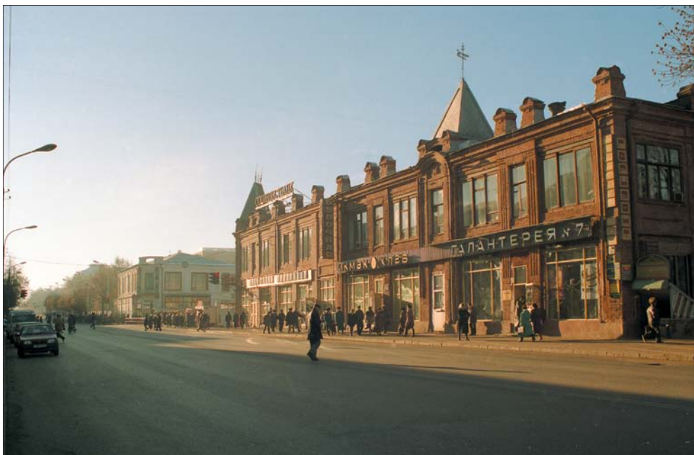
Бесснежный декабрь. 1996