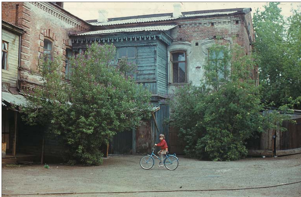
Уютный дворик (на месте галереи ART). 1991