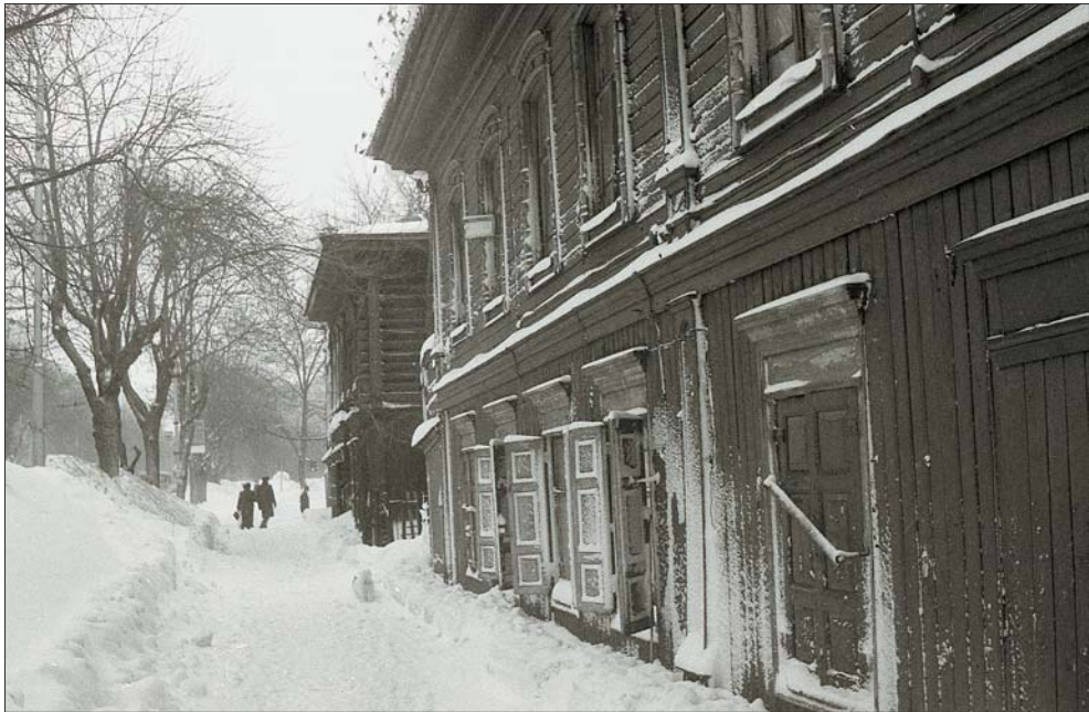
После вьюги (ул. Цюрупы). 1998