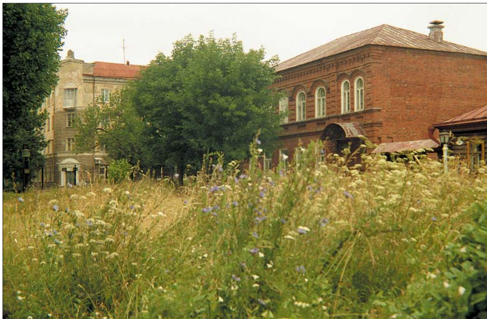
Ленинский мемориал. 2001