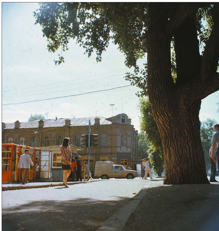
Старый тополь. Ул. Фрунзе, 1992