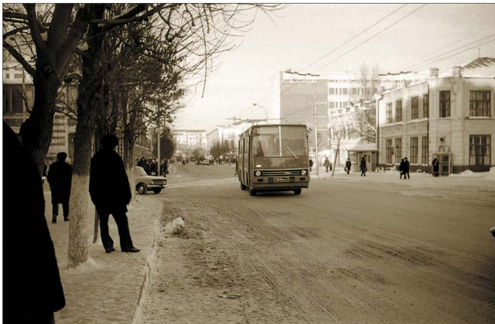
Воспоминание об уфимском базаре. 1974