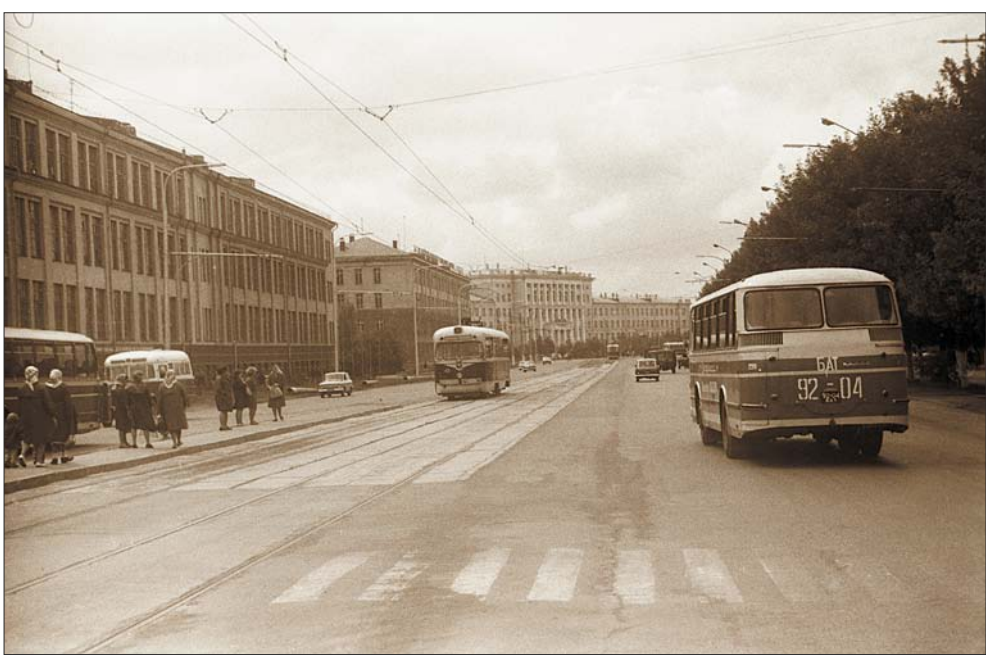
Трамвайная остановка. 1973