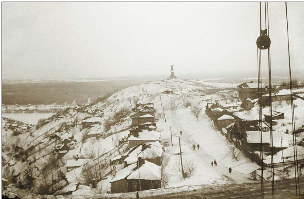
Давным-давно в марте. 1972