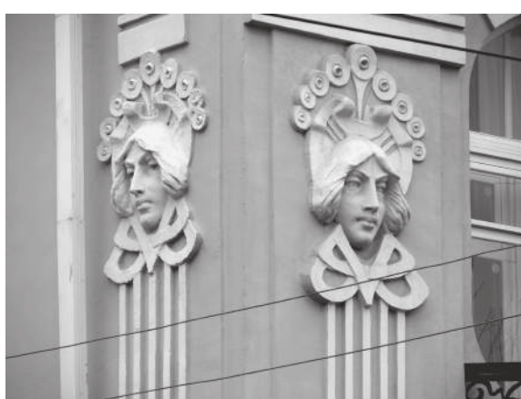
Маскароны на доме Костерина