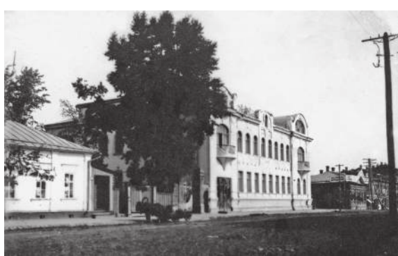
Дом Костерина.