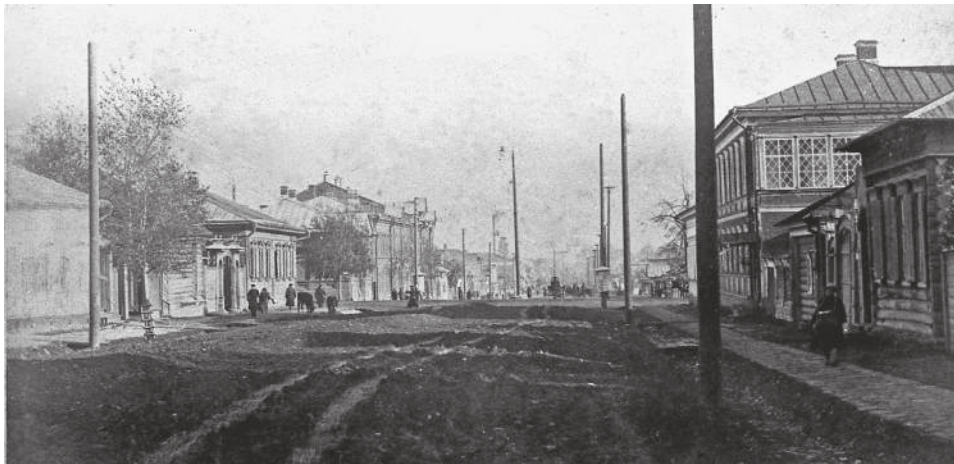
Улица Александровская, нач. XX в.

Сегодня я расскажу вам, как из мухи сделать... Нет, лучше про то, как десяток-другой трёхрублёвых дамочек умудрялись обеспечивать тысячерублёвое содержание огромного особняка. А может, вам будет интереснее узнать о том, почему богатейший купец с большим семейством жил в публичном доме?