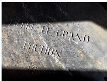
Стол, за которым Пётр Великий пил воду в Спа.

В Спа Пётр пробыл примерно четыре недели. Его лечение было настолько колоритным, что оставило глубокий отпечаток на все последующие поколения. Не случайно жители Спа до сих пор считают Петра своим попечителем и созидателем. А в 2017 г., во время празднования 300-летия со дня приезда Петра Великого на бельгийскую землю, ему было навечно присвоено звание почётного жителя города.