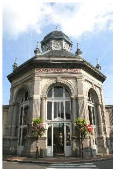
Пуон Петра Великого в Спа.

нём проводятся многочисленные тематические выставки и разнообразные культурные мероприятия. Окончательная версия здания была реализована бельгийским архитектором Лео Газбруком в послевоенные годы, после частичного разрушения города немецкими фашистами. При входе в «пуон Петра Великого» (как официально теперь называется это здание, расположенное на одноимённой площади), можно увидеть знаменитую картину Антуана Фонтена «Золотая книга». На ней изображены знаменитости, в разные годы посетившие город и его источники. На девятиметровой картине можно увидеть 92 персонажа, среди которых – Виктор Гюго, Декарт, Альфьери, Кокриль, Монтеверди, Тёрнер, Курбэ, генерал Бернедот и, конечно же, Пётр Великий, самый знаменитый из гостей Спа. Список этих личностей был согласован с известным бельгийским историком и архивистом Альбином Боди, одним из редакторов значимого «Журнала льежского общества валлонской литературы», а также автором книги «Пётр Великий на водах в Спа».