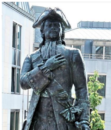
Памятник Петру I в Льеже. 2017 г. Автор скульптуры А. Таратынов, автор проекта В. Двойников.

P.S. В 2017 г. по инициативе Фонда поддержки развития культурных и научных связей им. Петра Великого (В. Двойников) и при поддержке Посольства РФ в Бельгии, торговой палаты РФ по Бельгии и Люксембургу, Провинции Льежа и ассоциации «Гран Льеж», в центре Льежа, на площади Святого Петра, был воздвигнут памятник Петру Великому (автор скульптуры А.М. Таратынов).