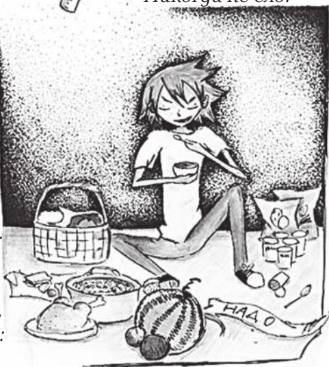
Рис. Ирины Ждановой

Знаю я, ребята, В чём тут было дело, Где скрывалось Надо: Просто Надо ело!