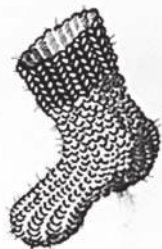
Рис. Оксаны Москвич