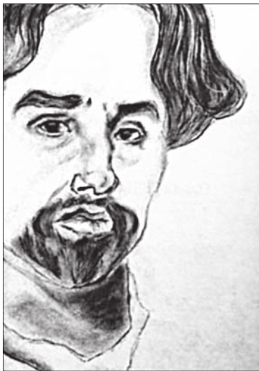
Портрет Великого художника