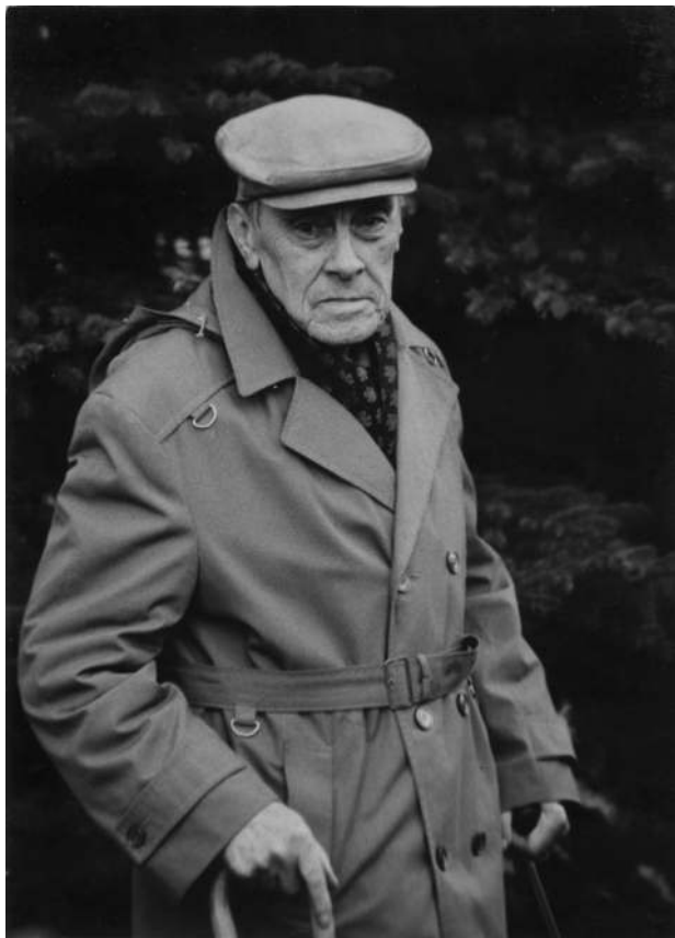
Арсений Тарковский.

что не получается и больше об этом не думал. А напрасно. За два дня до выступления мне позвонила дама, которая занималась нашими мероприятиями и радостно сообщила, что она договорилась с Петром Вегиним, и он тоже выступит на этом вечере. Меня это сообщение несколько ошарашило. Во-первых, я на тот момент просто не знал, кто такой Вегин. Во-вторых, совмещение в одном вечере столь разнокалиберных выступающих мне казалось совершенно неуместным. Я попытался возражать, но это было бесполезно.