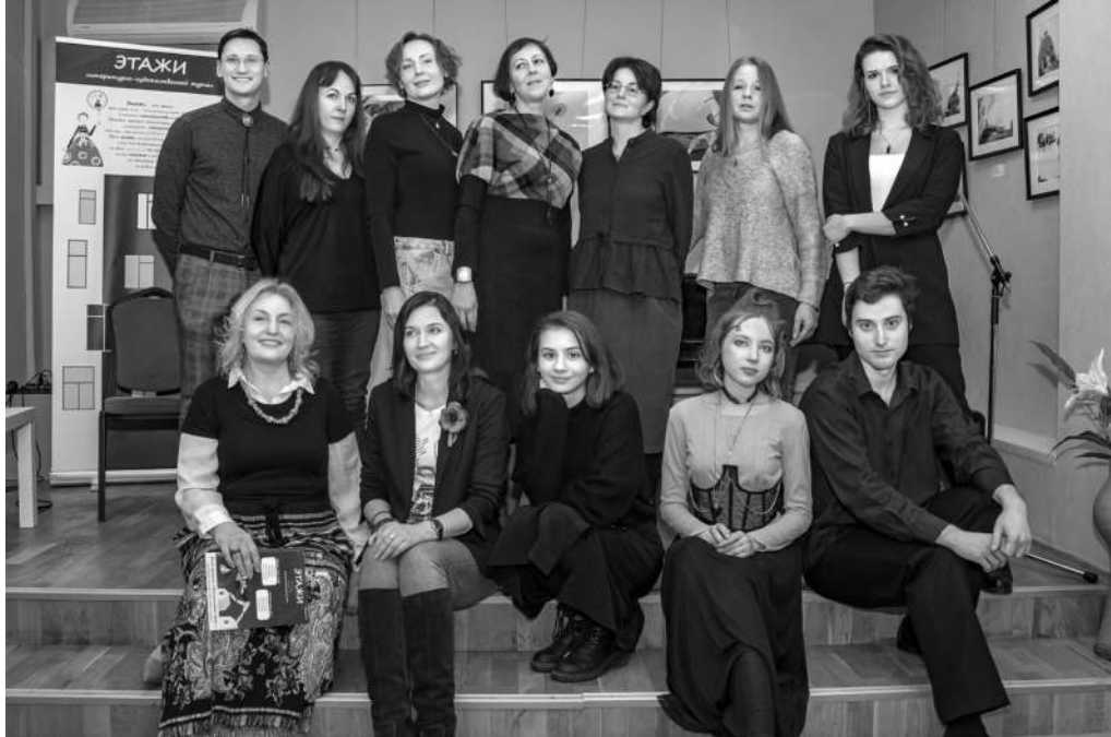
Авторы, лауреаты, студенты театральных мастерских

веду выдержку из репортажа Антон Ситникова для Contact Boston, где наиболее подробно описываются события вечера: