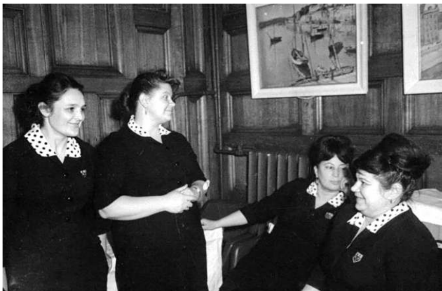
Официантки Центрального дома литераторов, 1969 г.

Часто компании перетекали из клуба в клуб. И всюду, но, большей частью в ЦДЛ, встречали людей из иной организации. Может, потому, что в их доме культуры на Большой Лубянке не было ресторана с подачей напитков?