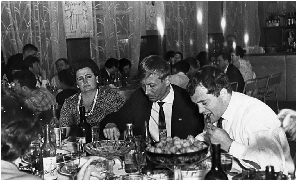
Евгений Евтушенко и Василий Аксенов в ЦДЛ, 1964 год.