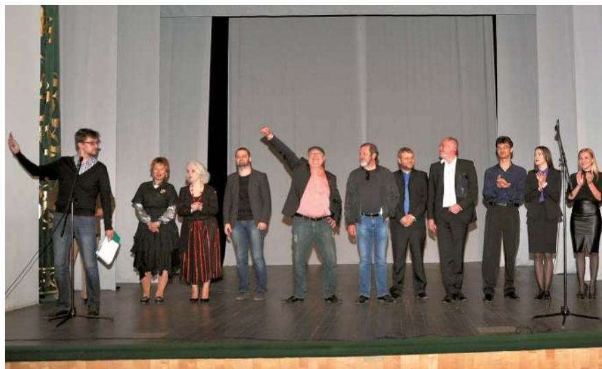
Литературное шоу «Актеры против поэтов»