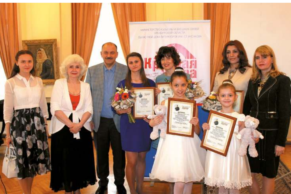
Вручение премии «Чаша бытия»