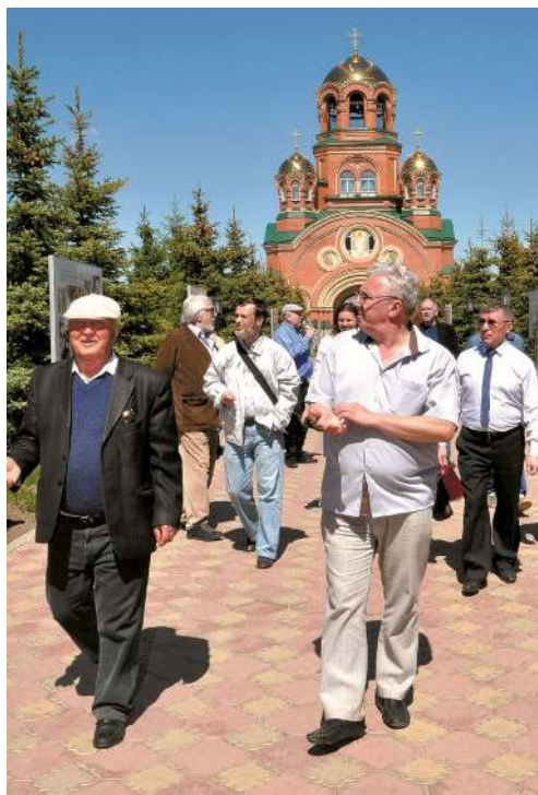
Оренбургские писатели и гости фестиваля в Свято-Троицкой Симеоновой Обители Милосердия (п. Саракташ)