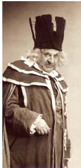
Артист М.М. Тарханов