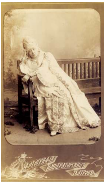
Актриса В.Ф. Комиссаржевская