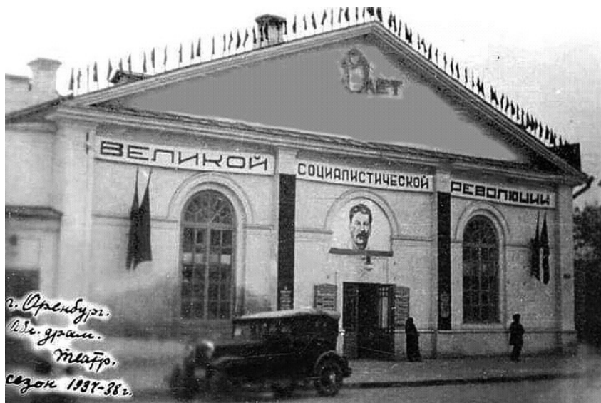
Областной драматический театр, 1937-38 гг.

местных изданий в XIX — начале XX вв., также из ранних источников Государственного архива Оренбургской области.