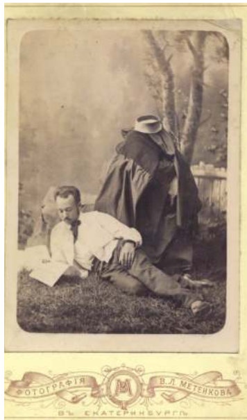
Актёр А.М. Звездич