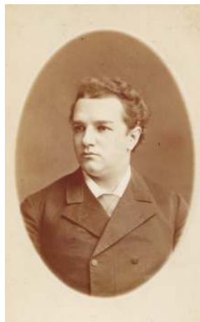
Артист М.И. Писарев