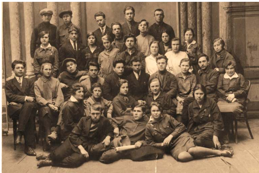
Коллектив театра, 1920-е гг.