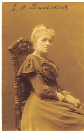
Актриса Е.Н. Бельская