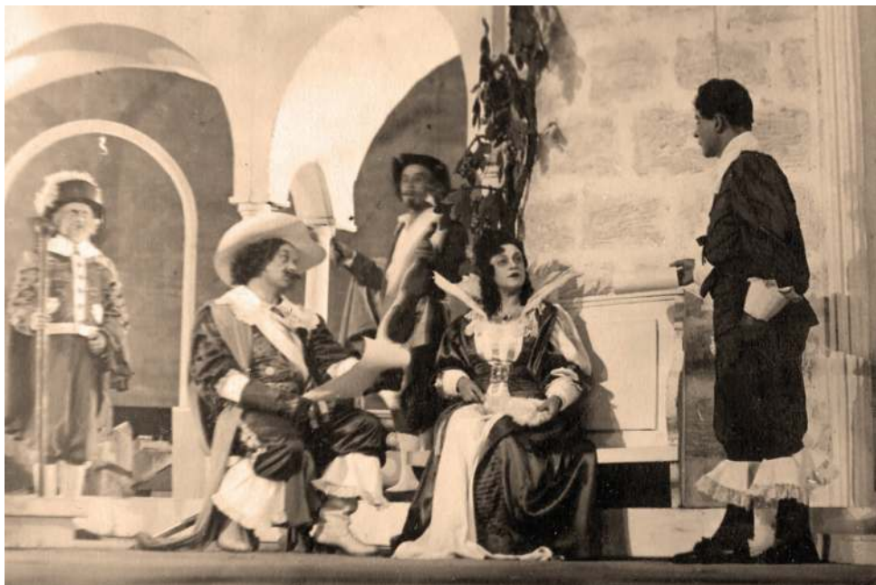
«Собака на сене», 1938 или 1943 гг. Лопе де Вега