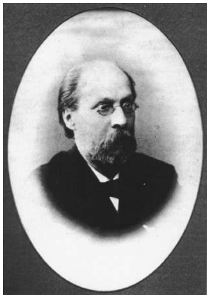
Вагнер Н.П., середина 80-х гг. XIX века

Не только в российской, но, пожалуй, и в мировой истории вряд ли найдётся значительное количество самобытных, неординарных, в чём-то уникальных своей универсальностью и творческих, подобных Н. Венгеру. Тем редостнее сознать уже нашим современникам, что такая личность, как Н. Венгер, так или иначе был связан с их краем. Неслучаен сегодня к нему интерес как к земляку уральцев, ведь