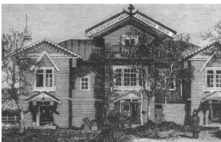
Биологическая станция Соловецкой обители. Гравюра из книги Н.П. Вагнера «Беспозвоночные Белого моря»

годы з метно усилился интерес к его научной деятельности со стороны современных исследователей и учёных, о чём свидетельствуют материалы научных конференций МГУ и СПбГУ, Мурманского морского биологического института РАН, который находится на месте первой в России Соловецкой биологической станции, созданной Н.П. Вагнером, и др. [9].