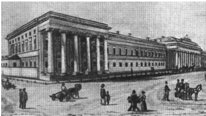
Казанский университет, XIX век