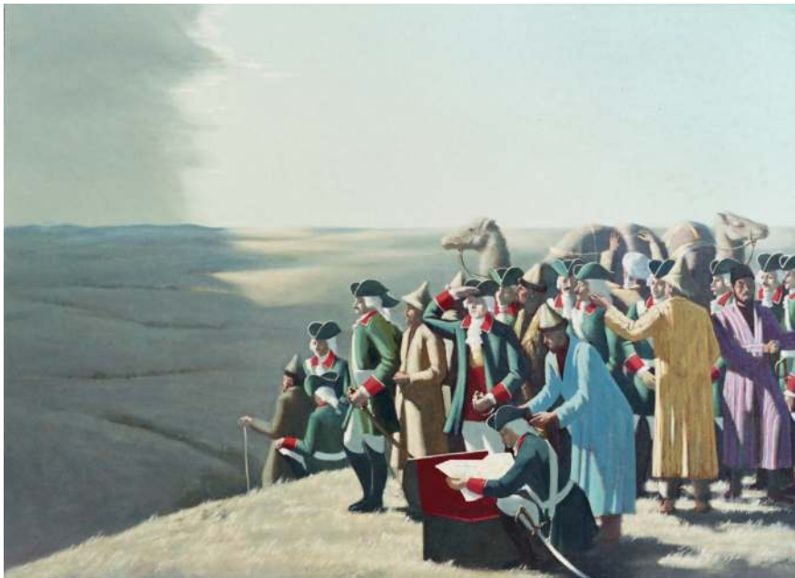
Из истории Оренбурга. 1980-е. Холст, масло