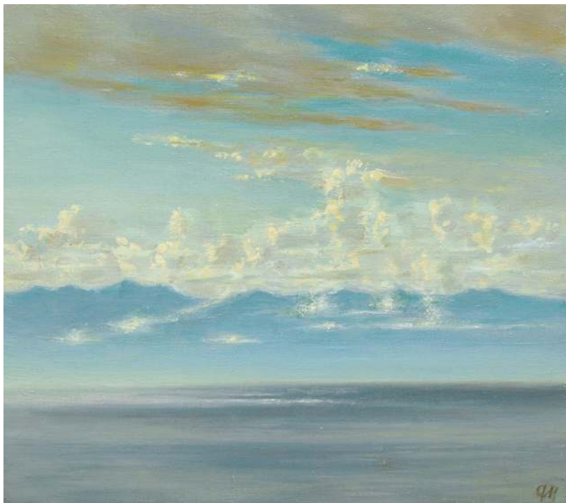
Байкал. 2001. Холст, масло. Частная коллекция