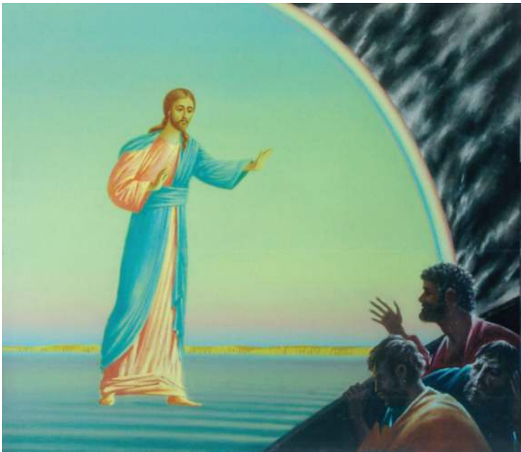
Хождение по водам. 2007. Холст, масло