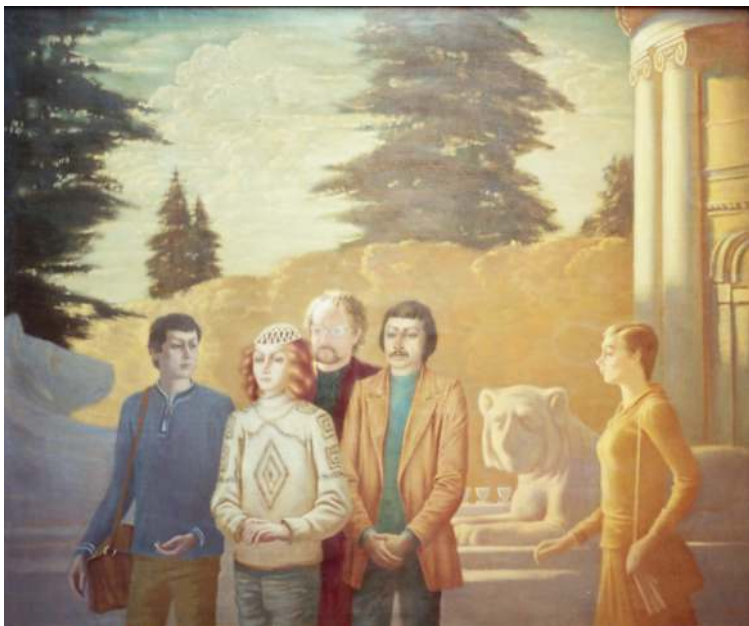
В Архангельском. 1985. Холст, масло