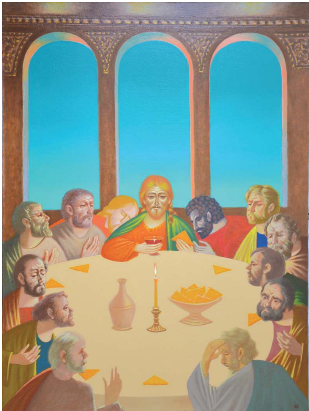
Тайная вечеря. 2007-2011. Холст, масло