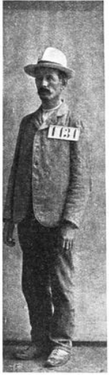
Фотопортретъ въ натурѣ величинѣ.

3) По всей речке, стоя на 1/4 вь томъ самомъ головномъ уборѣ, верхъ платка и обуви, въ которъ былъ задержанъ. Если носить очки, то одѣтъ. Для срочной гонки оставить около сѣдлакаго обманъ, ступа.