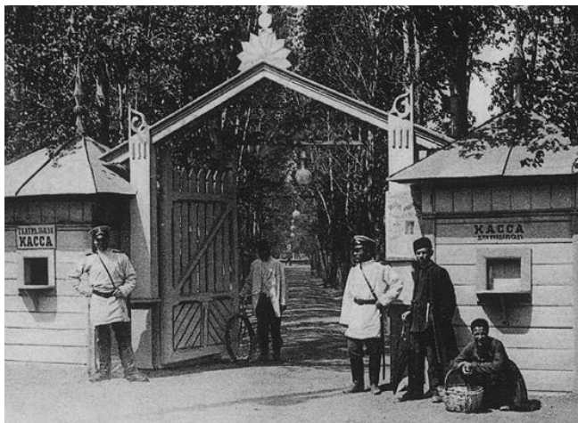
Полицейские, обеспечивающие порядок и благочиние у входа в Тополёвый сад. 1905 год

В 1878 году в 46 губерниях, управляемых по Общему