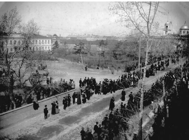
Полицейские проводят учебный сбор населения по сигналу о пожаре

топили печей весной и летом во время сильных ветров и «если кто презирал своё и общественное благо, иметь будет огонь, то разрушителей надлежало брать под стражу». Тогда же, в 1817 году, губернатор распорядился, чтобы полиция наблюдала за чистотой. Она была обязана также организовывать учения