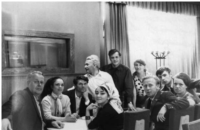
Москва, 1970 год. После фестиваля в Венгрии с коллективом театра кукол