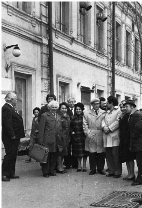
Участники семинара режиссёров и драматургов

были одушевлены милохинские герои, беззаветно влюблённые, красиво страдающие, обретающие в финале заслуженные любовь и счастье. Пришла зрелость — появились новые амплуа. В той же «Сильве» он стал играть характерные роли — Бони, Ферри. А выход на сцену в образе князя Воляпока обозначил следующий этап актёрской жизни — переход на возрастные роли.