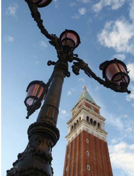
Вид на башню на площади Святого Марка. Венеция. Италия