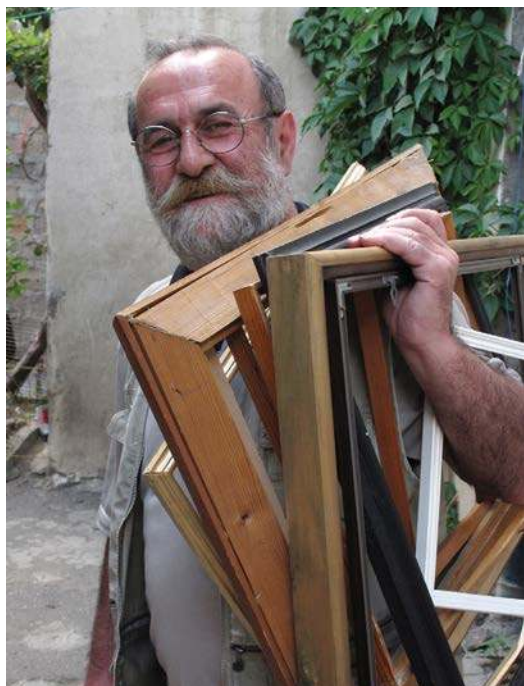
Портрет художника Мартироса Бадаляна. Армения