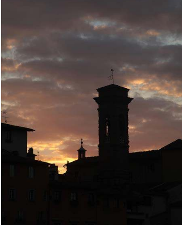
В Вавельском замке. Краков. Польша