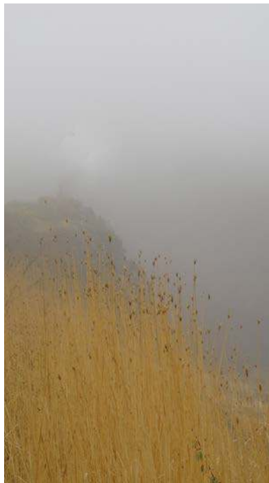
Туман в Гарни. Армения