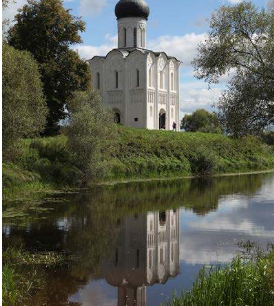
Вид на церковь Покрова на Нерли близ Владимира