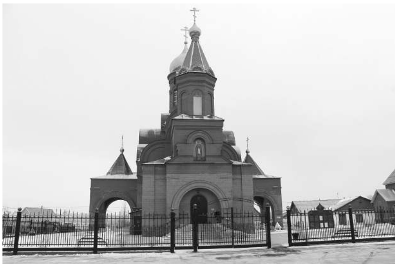
Новосергиевский храм сегодня