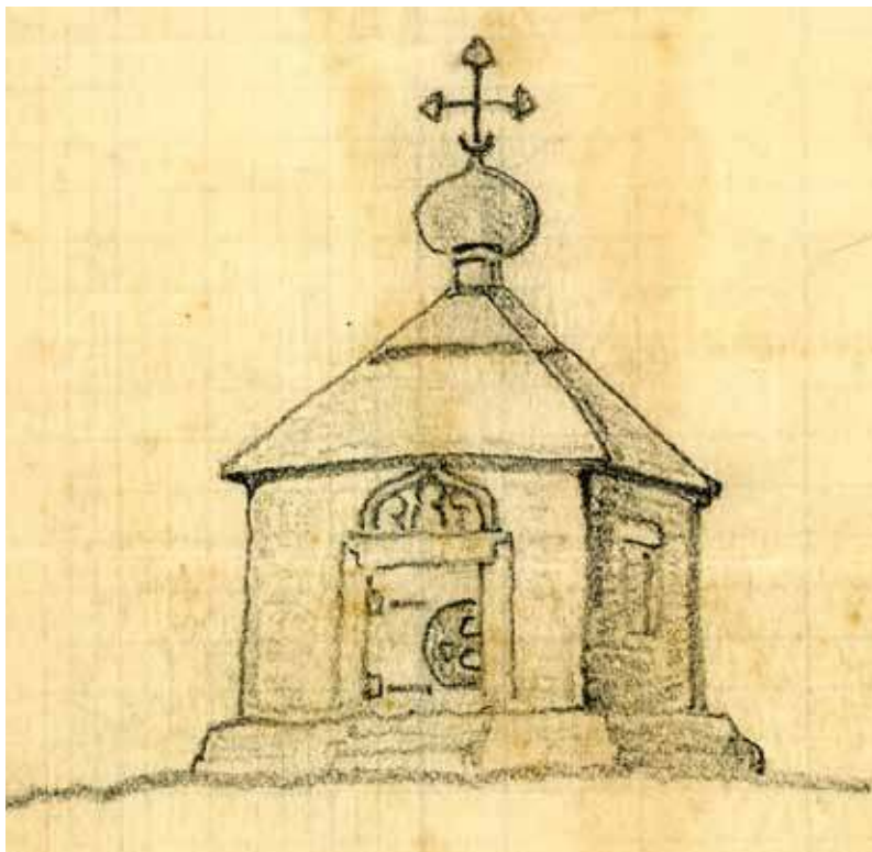
Оригинал эскиза часовни св. Сергия Радонежского в Чураевке, выполненный Н.К. Рерихом в 1929 году. Бумага, карандаш. 14,6 × 11,5

За рамками этого письма стоит малоизвестный сюжет о поездке Николая и Юрия Рерихов в деревню Чураевку в августе 1929 года. Чураевка — это поселение русских эмигрантов в 75 милях от Нью-Йорка,