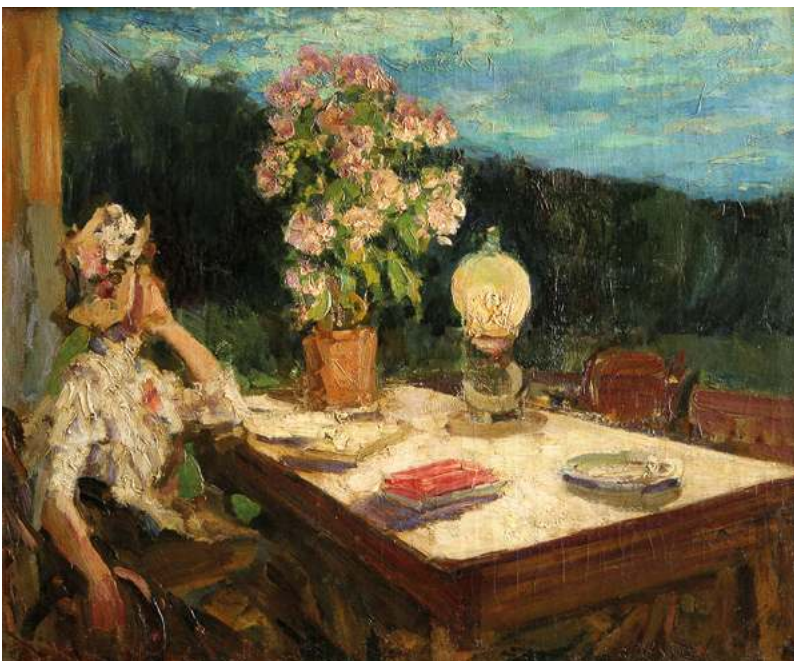
Константин Коровин. Дама с лампой. 1910. Холст, масло. 53,5х65

Саврасов, несмотря на все старания и помощь друзей, так и не сумеет преодолеть выпавшие ему тяжкие житейские испытания. Измученный и почти слепой, он умирает в больнице для бедных на Хитровке. А через три года после кончины учителя, немного не дожив до своего сорокалетия, скончается и Левитан. На его мольберте останется недописанное полотно «Озеро. Русь» — «лебединая песня мастера». Антон Павлович Чехов высоко оценил достоинства картины, сказав о ней: «До такой изумительной простоты и ясности мотива, до которых дошел в последнее время Левитан, никто не доходил до него, да не знаю, дойдет ли кто и после». На выставке в ГХМАК можно увидеть этюд облачного неба к этой великой картине (Облака. Этюд к картине «Озеро»).