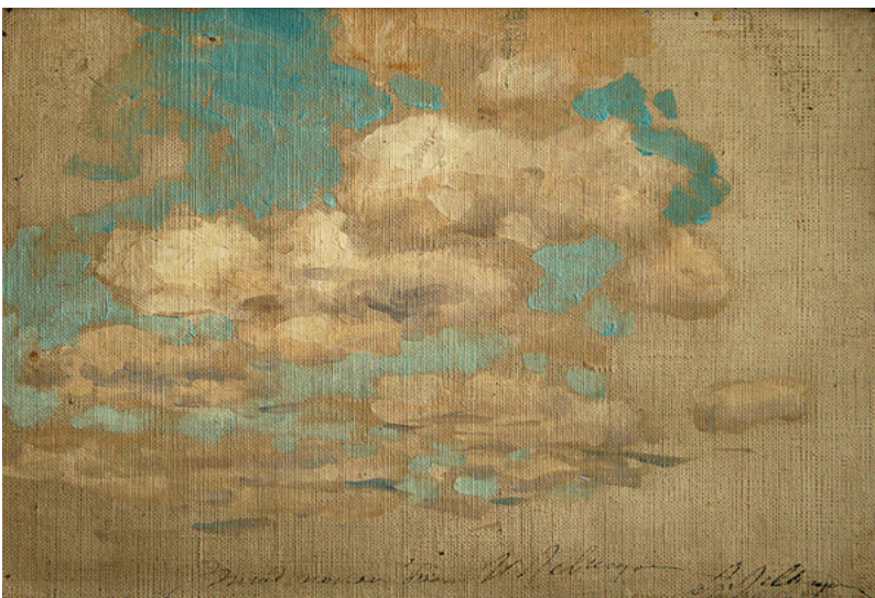
Исаак Левитан. Облака. Этюд к картине «Озеро». 1899. Холст, картон, масло. 21х31,5