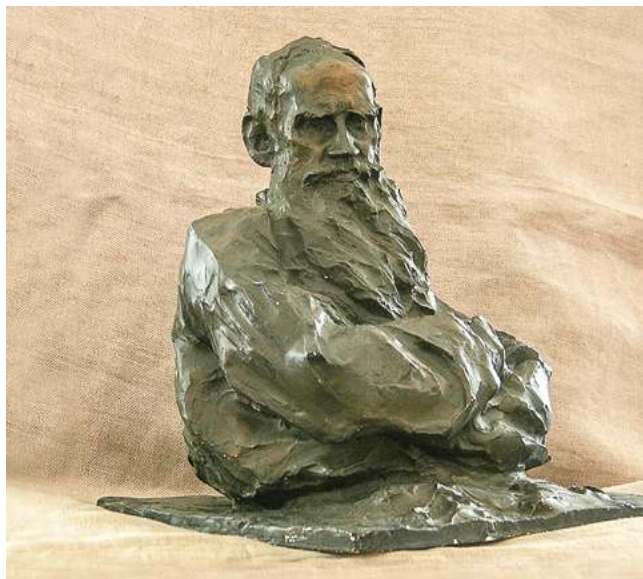
Павел Трубецкой. Портрет Л.Н. Толстого. 1899. Гипс, тонировка. 29,3x31,2x36,5

Ныне в доме Юшкова находится Российская академия живописи, ваяния и зодчества. Ее основал в 1989 году Илья Сергеевич Глазунов. Согласно Уставу, академия возрождает традиции бывшего здесь училища живописи, ваяния и зодчества. Круг замкнулся. «Капризная муза» улыбается новым студентам. ■