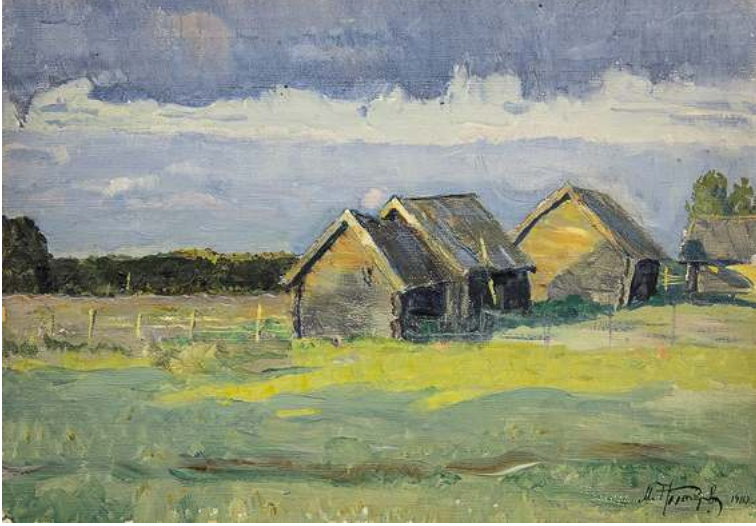
Михаил Несторов. Этнод. Сараци. 1910. Холст, картон, масло. 21,5x30