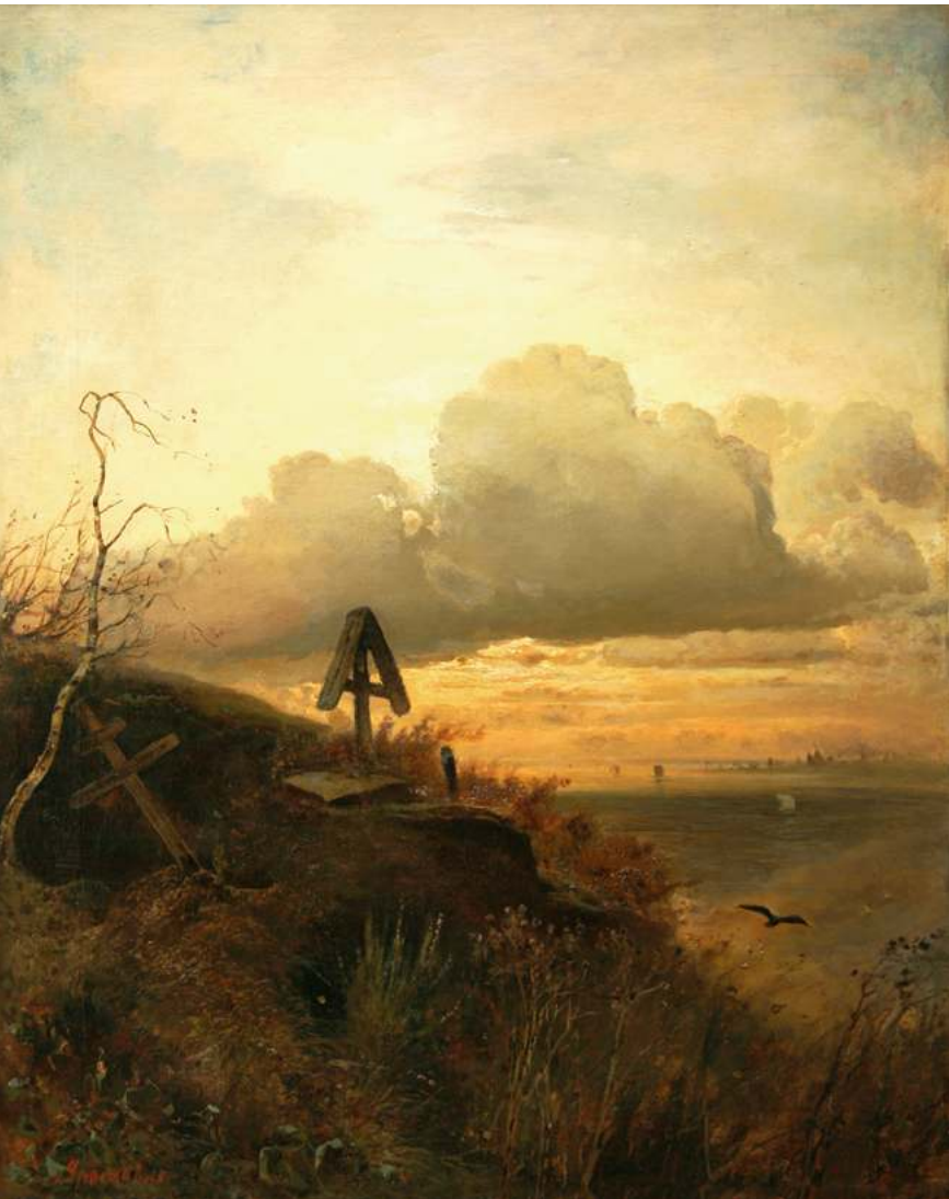
Алексей Саврасов. Могила над Волгой . 1874. Холст, масло. 81,3х65

По воспоминаниям очевидцев, Левитан при первой встрече с картиной плакал возле нее. Когда случайные свидетели этой встречи спросили у художника: «Почему вы плачете?», тот ответил: «Я хотел бы быть Саврасовым!» Работая над картиной, художник уделил огромное внимание небу. «...Здесь туча, как горе, тепло и свет, как радость и надежда», — отмечали современники. Позже Исаак Ильич назовет своего учителя «одним из самых глубоких русских живописцев, умевшим отыскать и в самом простом и обыкновенном те интимные, глубоко трогательные, часто печальные черты, которые так сильно чувствуются в нашем родном пейзаже и так неотразимо действуют на душу...» Левитан создаст и свой шедевр, самую русскую в русском искусстве картину «Над вечным покоем».