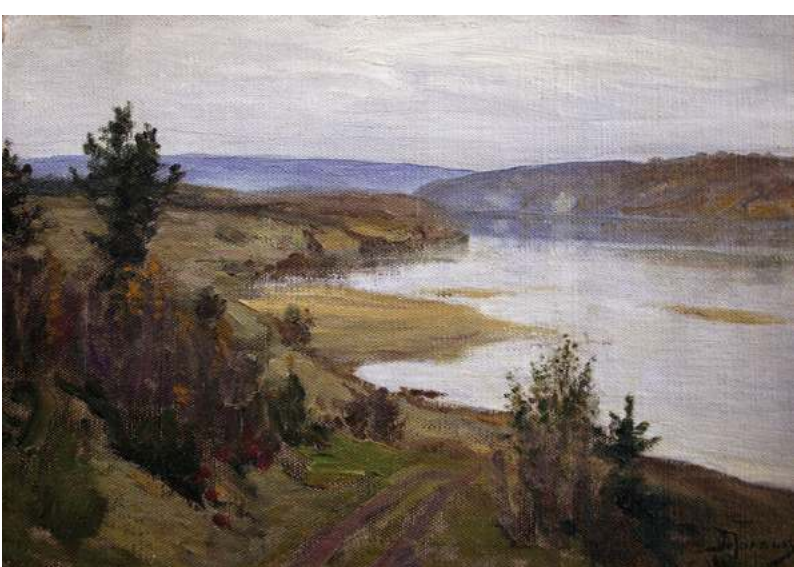
Василий Поленов. Вечер на Оке. Холст, масло. 27х37,5