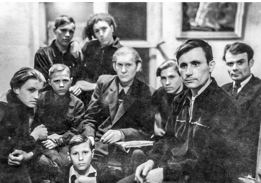
Студийцы. 1960-е.

Большая часть художественного наследия мастера посвящена природе Алтая. Безграничные просторы края рождали в его душе особые чувства. «Обрел я на Алтае вторую родину. Благодарен Всевышнему, что он привел меня в этот удивительный уголок земли...» — говорил Владислав Тихонов. Настроение покоя и умиротворенности отчетливо звучит в картине «Осень». Приглушенный колорит, в котором различимы голубовато-серебристые, оливково-