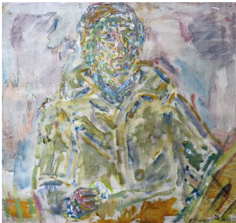
Валентина Диффинэ-Кристи. Автопортрет. 1990. Картон, масло

Надо признать, что нечасто наш зритель имеет возможность видеть столичное искусство, но в 2020 году известные московские художники дважды стали экспонентами художественного музея Алтайского края. Вадим Кислых (его выставка работала в музее в феврале-марте) и Валентина Диффинэ-Кристи (время экспонирования — август-сентябрь) познакомили нас с яркими страницами московской школы живописи. Хочется верить, что такие встречи с московским искусством продолжатся и впредь, как и в то, что богатейшая коллекция нашего художественного музея еще не раз покажет свои шедевры в столичных музеях. ❀