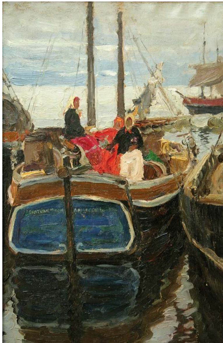
Сергей Виноградов. Пейзаж. У пристани. 1903. Холст, масло. 68х42