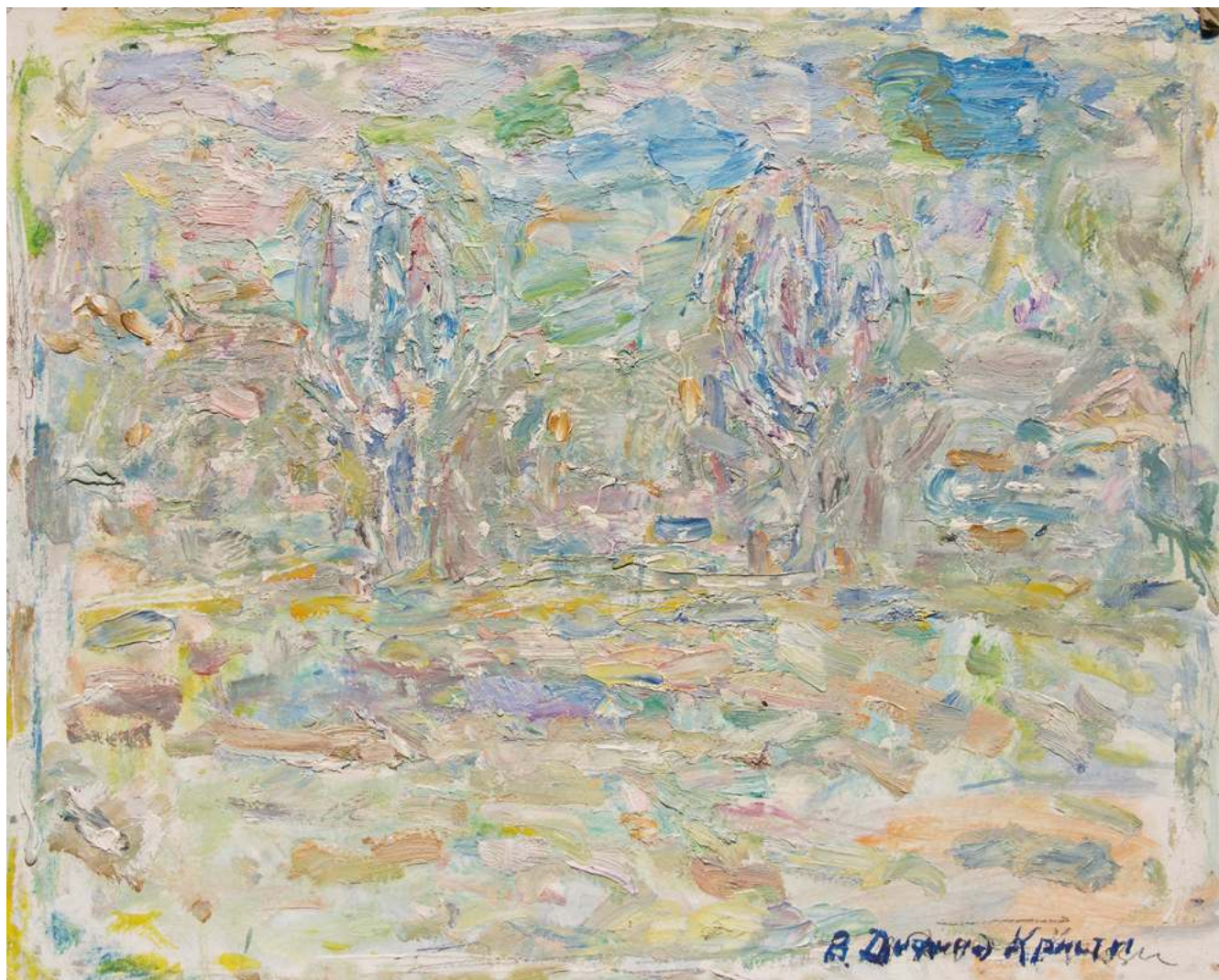
Валентина Диффинэ-Кристи. Весна. Два куста. 1970. Картон, масло