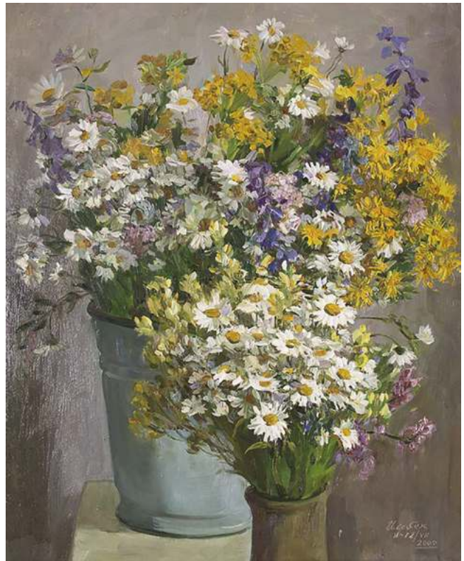
Ильбек Хайрулинов. Ромашки. 2000. Картон, масло. 65,5x53,5