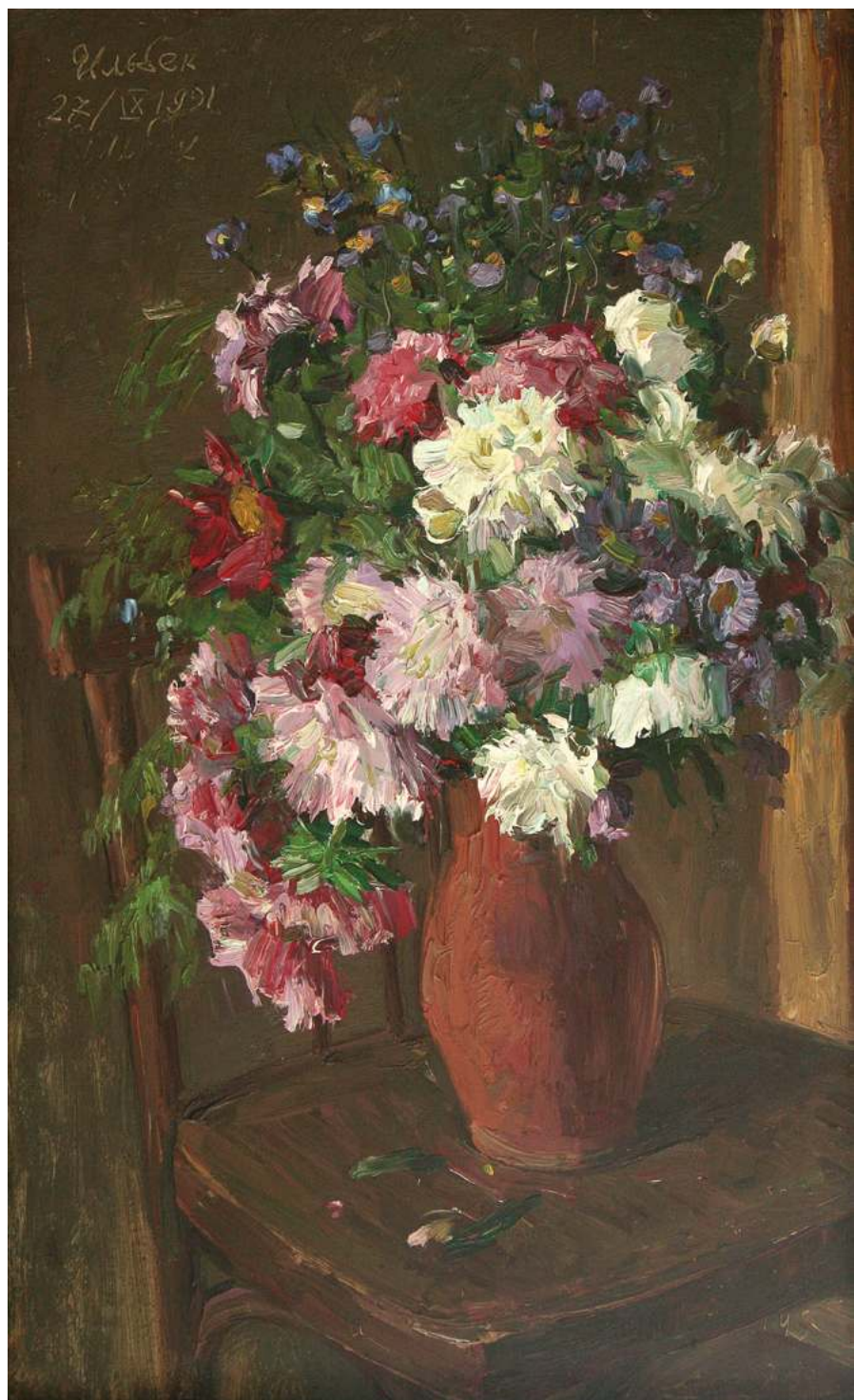
Ильбек Хайрулинов. Торжественный букет. 1991. Картон, масло. 79x49