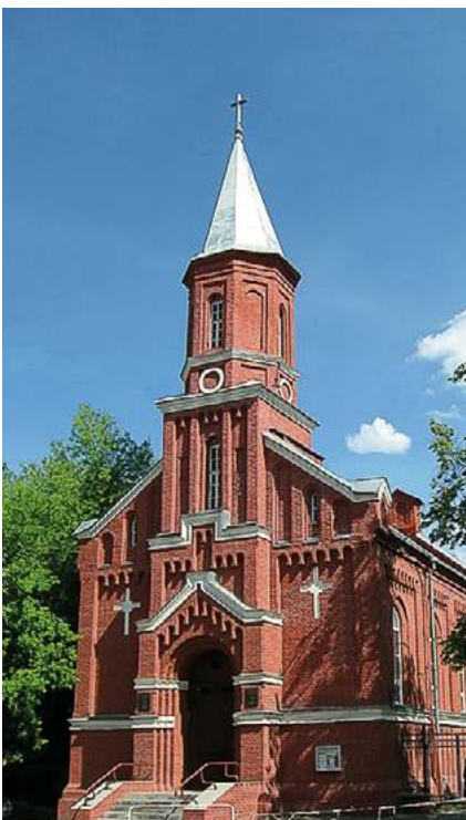
Лютеранская церковь Св. Марии в Перми. Современный внешний и внутренний вид