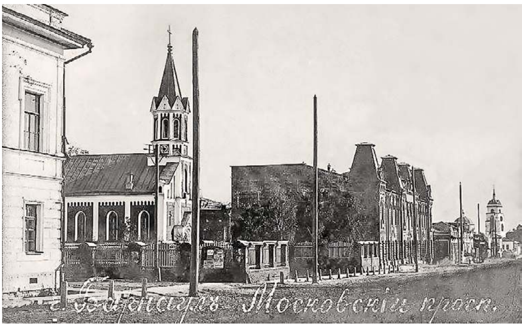
Барнаульская лютеранская церковь Св. ап. Павла на Московском проспекте. Фото начала XX века

что непосредственно зданием кирхи занято 35,44 кв. сажени, а еще 76,93 кв. сажени это — небольшой церковный сад перед ней, что в совокупности как раз и дает цифру в 112,37 кв. сажени, то есть ту площадь, которой верующие еще могли пока пользоваться. Территория справа, между церковью и тем, что названо «военным лазаретом» (сейчас магазин «Красный»), определена в выкопировке как «Свалочное место отбросов строительных материалов и сора Алтгубисполкома и Госпиталя». Площадь слева от лютеранской церкви и до улицы Короленко, которая тогда пересекала Московский (сегодня Ленинский) проспект, обозначена на выкопировке как «Складочное место строительных мат. Алтгубисполкома». Иными словами, за все эти «свалочные» и «складочные» места, размером в 266,35 кв. сажени или в две трети от площади церковного участка, Алтгубисполком в лице своего землеарендного подразделения ежегодно требовал с верующих деньги за аренду.