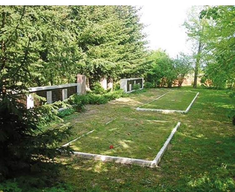
Братская могила советских воинов в Слампе (Латвия). Современный вид.