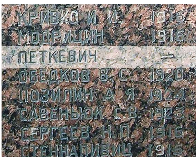
Обелиск. «Петкевич».

Просмотр всех фотографий, сделанных на братском кладбище в Слампе, привел к еще одной находке. Помимо двух кирпичных стен (с установленными на них мемориальными плитами) на участке есть также обелиски (они находятся между стенами). На одном из обелисков в столбике фамилий удалось разглядеть фамилию отца поэта, на этот раз правильно написанную: