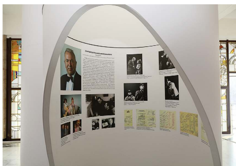
Фрагменты экспозиции.