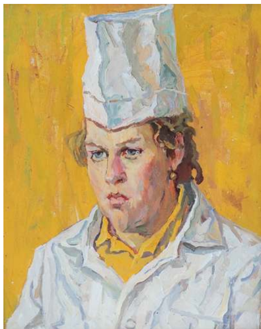
Геннадий Борунов. Медсестра. 1980. Холст, масло. 60x50