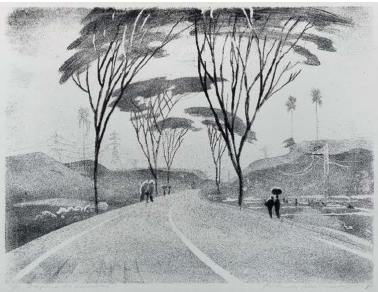
Владимир Ветрогонский. Дорога на Каптай. Из серии «Дорогами мира» (Бангладеш). 1975–1984. Бумага, автолитография. Л: 60x74,5. И: 49x63. Из собрания ГХМАК