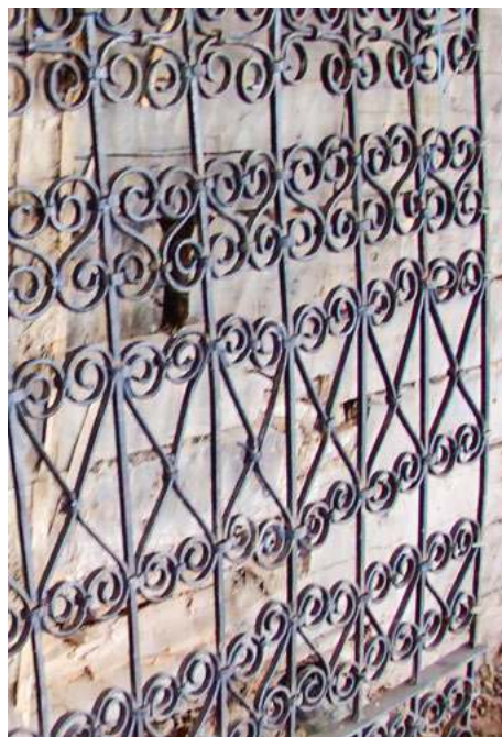
Фрагмент решетки церковной ограды, изготовленной в кузне И.Г. Полуженникова. 2007.

В семейном фотоальбоме старейшего работника образования Ребрихинского района Виктора Ефимовича Стародубцева сохранилась фотография учеников ребрихинской церковно-приходской школы. На обороте снимка имеется надпись: «На память Шуре. Нюра,