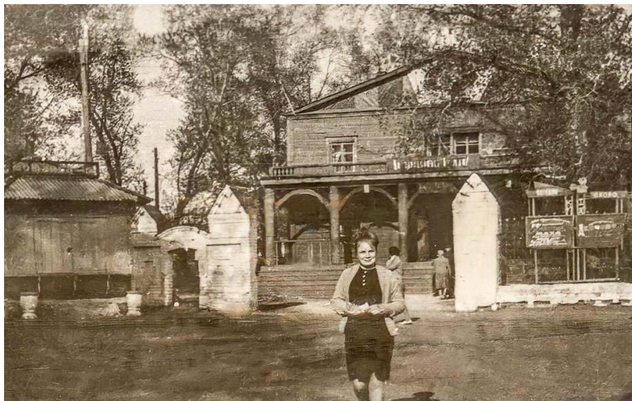
Бывшая церковь. Ребриха. 1968.

В 1924 году администрация Ребрихинского райисполкома приняла на службу в канцелярию в качестве