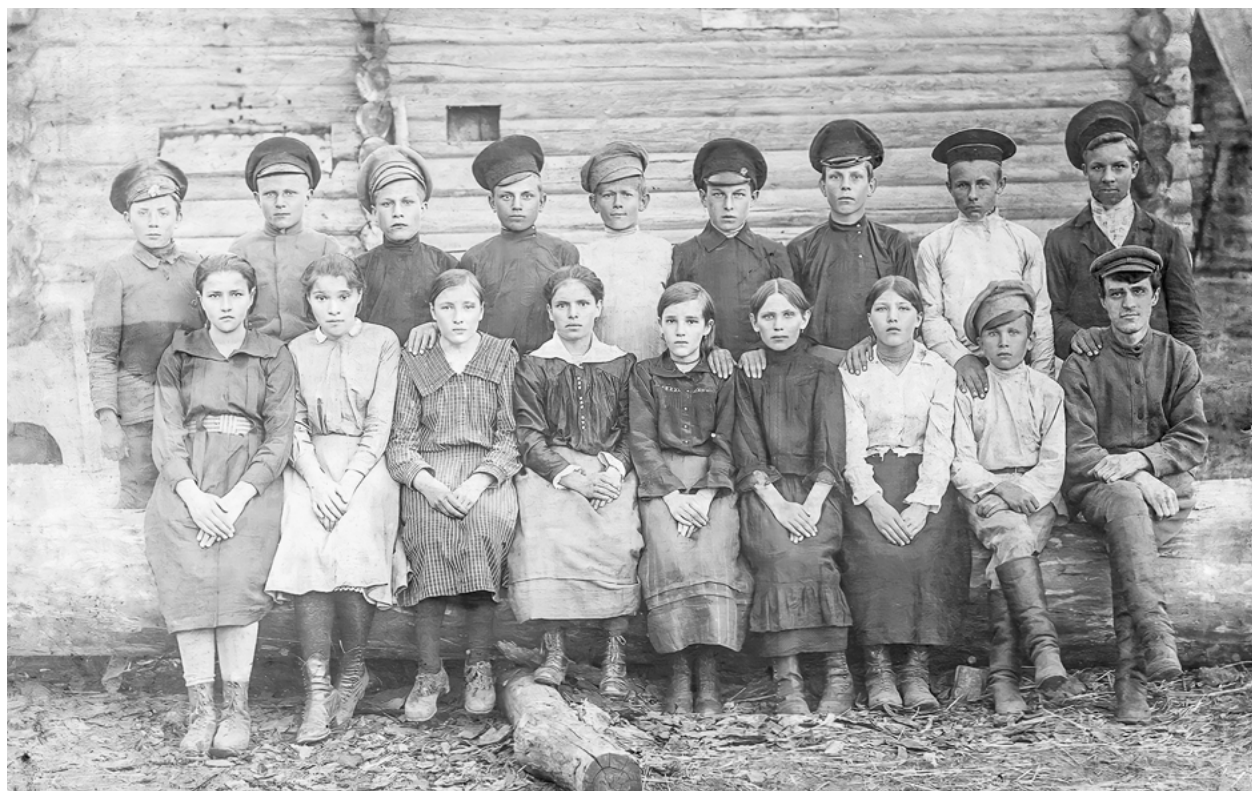
Ученики Ребрихинской церковно-приходской школы. 1916.