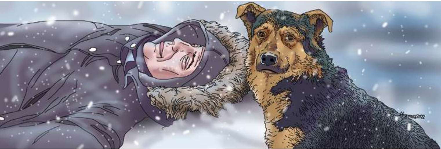
Рисунок Александра Карпова

— Нечего там делать! Знаю я эти ваши встречи одноклассников, друзей детства! Посиделки с водкой! А потом с давлением лежать!