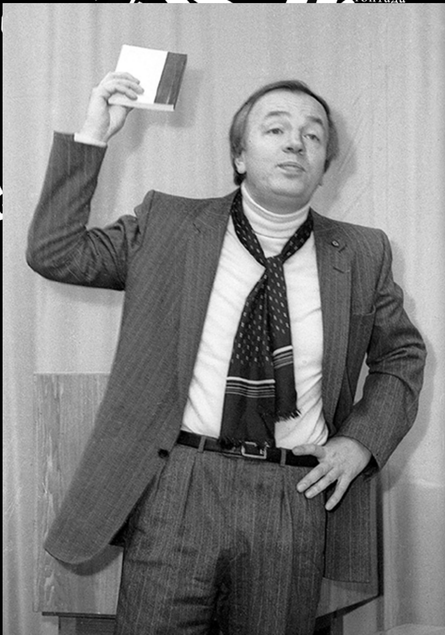
Андрей Вознесенский.

распада расплата РАСПАДА распада спасада ранская распа д партапарат РАСПА распада адапсарьраспада распутин ТОПТА ТОПТАДА спасада АС