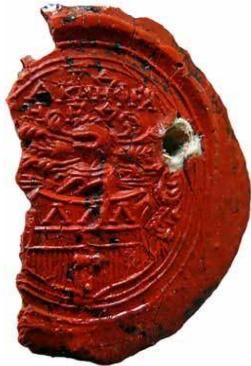
Печать с гербом Демидовых

Исходя из этих наблюдений, можно сделать предположение, что печать как могла быть личной при жизни Акинфия Демидова, так и после его смерти могла отождествляться с конкретным Невьянским заводом.