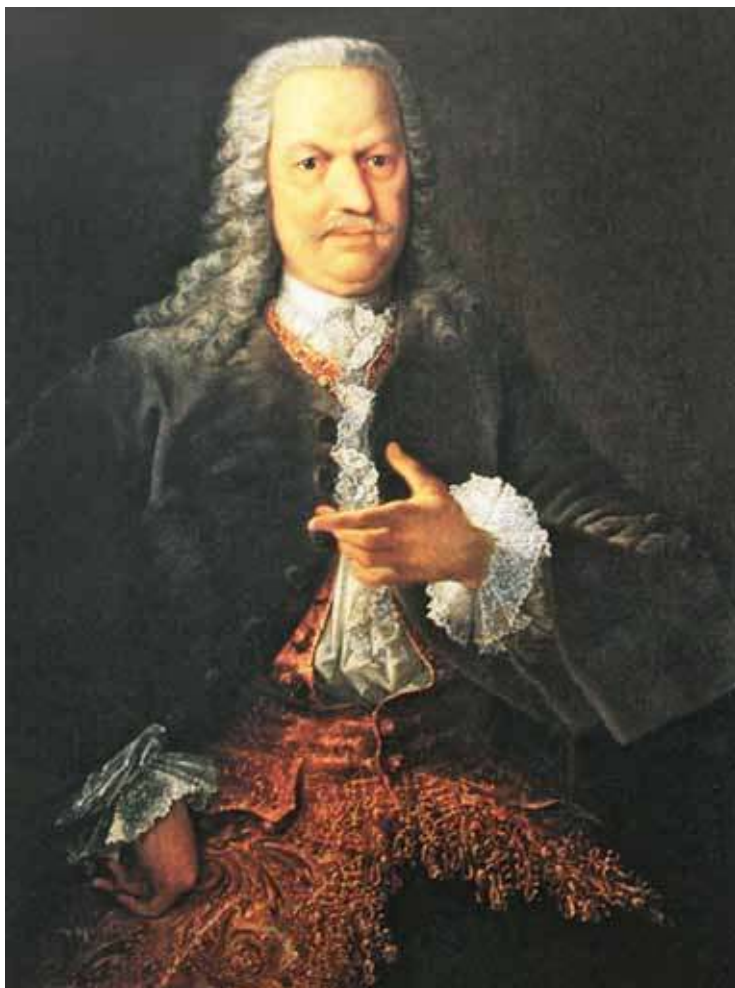
Гроот Георг Кристофор. Портрет А.Н. Демидова. 1745

Вроде бы сошлось, но тут опять берут сомнения. Нижняя буква «С» похожа и на букву Е, что в корне меняет дело, а уж если и верхнюю букву «П» читать, как «Х», то все наши стройные рассуждения идут прахом.