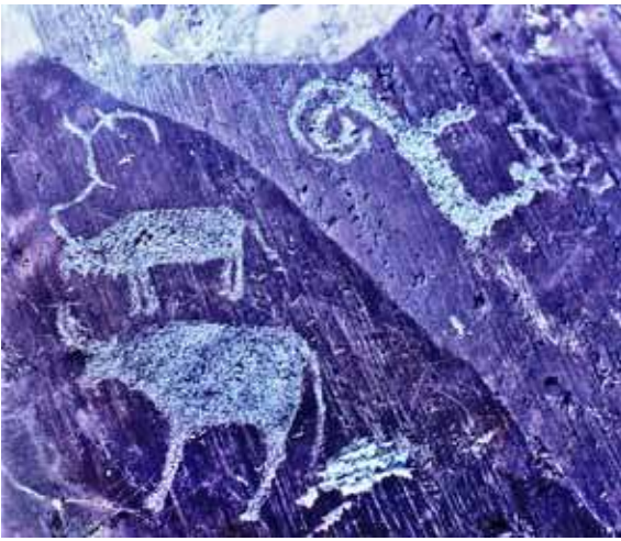
Наскальная живопись.

краеведческим музеем им. В. Бианки под руководством его директора, историка-археолога Бориса Хатмиевича Кадикова. Исследования велись по различной тематике: этнография народов Алтая, археология, топонимика.